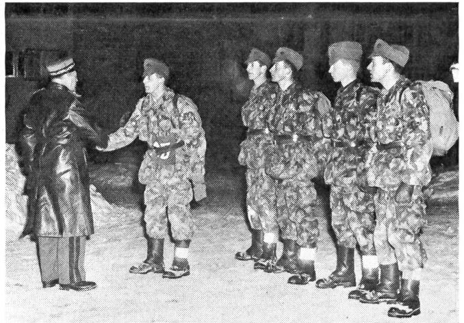
Die erste Patrouille ist am Ziel angekommen. Der Schulkommandant gratuliert den Aspiranten zu ihrer Leistung, denn es waren immerhin 112 Leistungskilometer!