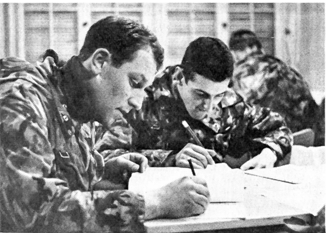
Hier gilt es zu beweisen, daß man als angehender Offizier auch nach 90 km Fußmarsch noch imstande ist zu überlegen und richtig zu handeln (theoretische Prüfung)