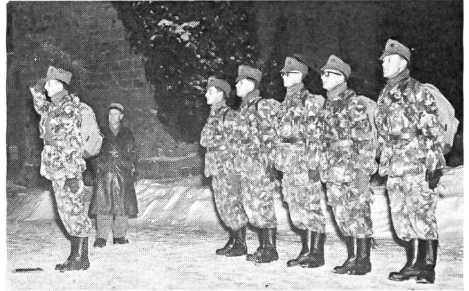
«Herr Major, melde Patrouille 8 zum Start bereit!» (Vor dem Start im Schloßhof der Kyburg bei Winterthur)