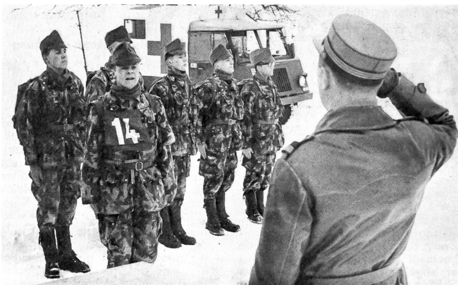
Auf einem Posten: «Herr Hauptmann, melde Patrouille 14!»

Dann, in der Morgenfrühe des zweiten Tages, ist es soweit: die erste Patrouille meldet sich in Achtung-