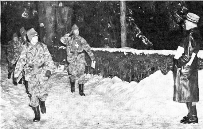
Der Schulkommandant verfolgt den Start, wie auch den ganzen übrigen Marsch, und wünscht den meldenden Patrouillen alles Gute