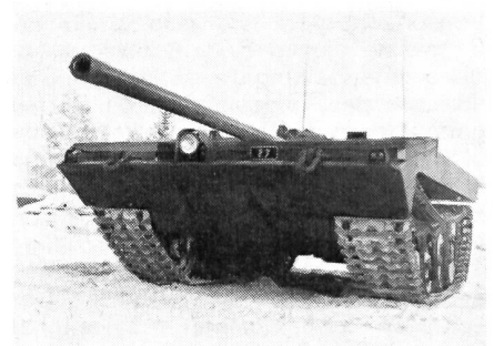
Frontansicht des neuen schwedischen «Kampfwagens S»

In den fünfziger Jahren erreichte die Panzerentwicklung nach schwedischer Ansicht so etwas wie eine Krise. Die taktischen Kernwaffen gaben den gepanzerten Fahrzeugen wieder erhöhte Bedeutung, während gleichzeitig eine gegen früher größere Beweglichkeit verlangt wurde. Das führte zur Forderung nach leichteren Kampfwagen, was vor allem für Schweden mit seinen zahlreichen und tiefen Flüssen vordringlich wurde. Mit den neuen Waffen ist der Gegner in der Lage, die wenigen Brücken rasch zu zerstören, die schwerere Panzer tragen könnten. Die Schweden forderten daher leichtere Panzer, welche die meisten der permanenten Brücken noch passieren können und die mit wenigen Handgriffen in die Lage versetzt werden, selbst Flüsse zu überqueren. Dazu kam noch die Forderung nach verstärkter Waffenwirkung und guter Schutzmöglichkeiten gegen neue Panzerabwehrwaffen wie auch gegen taktische Kernwaffen. Mit den Konstruktionsprinzipien, denen man bei der Panzerzeugung bisher folgte, hätte die Forderung nach vermehrter Waffenwirkung und Schutz nur mit dem Preis eines noch höheren Gewichtes bezahlt werden können. Man hat daher in Schweden die bisher geltenden Prinzipien verlassen, um den Forderungen nach größerer Beweglichkeit, gesteigerter Waffenwirkung und Schutzvorkehrungen besser gerecht zu werden. Das Resultat ist der neue «Kampfwagen S».