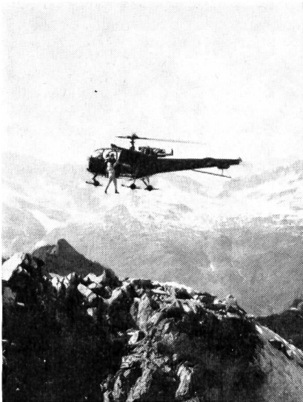
Turbinen-Hubschrauber «Alouette III» im militärischen Hochgebirgseinsatz