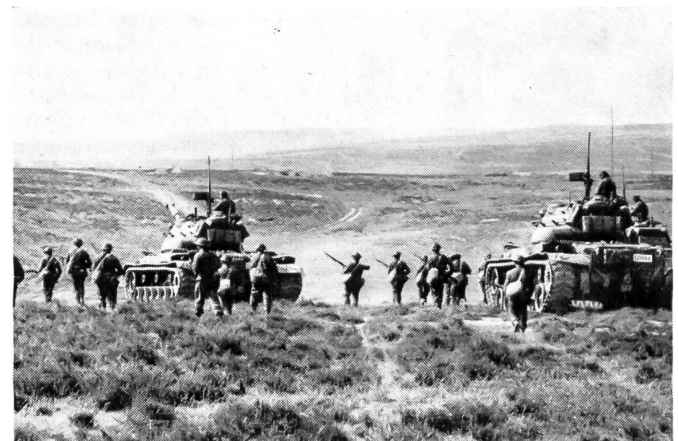
Hier ein Bild der typisch türkischen Landschaft, die in ihren Hauptteilen sehr panzergängig ist. Eine Aufnahme der Ausbildung in der 1. türkischen Armee-Division, in der die Zusammenarbeit von Panzern und Infanterie eine wichtige Rolle spielt