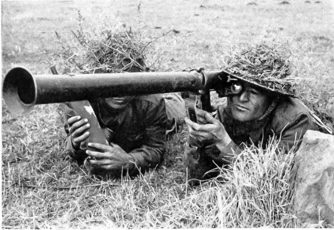
Die Panzerabwehr spielt in der Landesverteidigung der Türkei eine große Rolle, und die als zäh, ausdauernd und mutig bekannten türkischen Soldaten dürften vor allem für die Panzerabwehr besonders befähigt sein. Dazu gehört auch die Ausbildung am Raketenrohr, der Bazooka