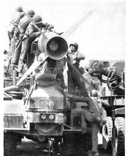
Zur Ausrüstung der türkischen Armee gehören heute auch Raketen. Unser Bild zeigt die Ausbildung an der «Honest John»-Rakete