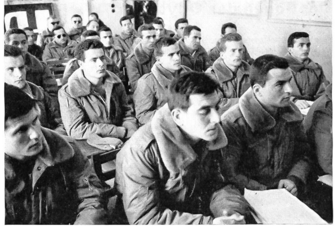
Die angehenden jungen türkischen Piloten der Luftwaffe haben sich einem langen und schwierigen Ausbildungsprogramm zu unterziehen, für dessen Aufnahme sie zuerst englisch und die Kommandosprache der NATO-Flugstreitkräfte lernen müssen. Die besten unter ihnen werden zur Weiterausbildung nach Amerika kommandiert, wo sie mit den modernsten Flugzeugen vertraut gemacht werden

allein für die Armee, die ohne Polizeikräfte einen Aktivbestand von gegen einer halben Million Mann hat, beanspruchen fast die Hälfte des Staatshaushaltes. Im Kriegsfall kann die Stärke der Armee bis zu zwei Millionen Mann erhöht werden. Jährlich werden rund 125 000 Mann eingezogen und ausgebildet.