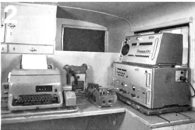
Zellweger AG., Uster/ZH Apparate- und Maschinenfabriken Uster