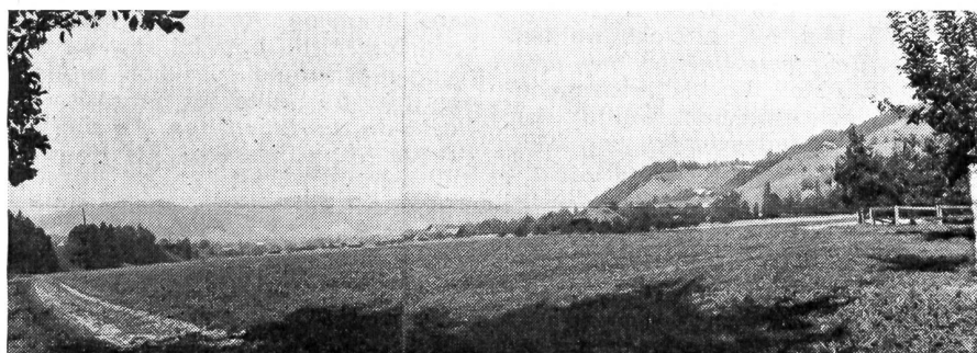
Blick aus den Häusern des Gehöftes von Ei in allgemeiner Richtung Emmenmatt. Links ist noch die Böschung der Straße nach Schüpbach-Signau sichtbar, während rechter Hand die Hänge gegen die Höhe von Bagischwand ansteigen.