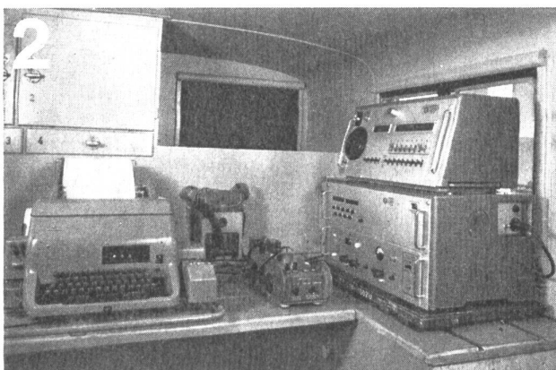
Zellweger AG., Uster/ZH Apparate- und Maschinenfabriken Uster