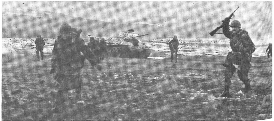
Zusammenarbeit Panzer-Infanterie. Ein Bild von der Ausbildung auf dem großen Truppenübungsplatz des Bundesheeres in Bruck an der Leitha.

Sollte nun der eine oder andere der hier erwähnten Pläne verwirklicht werden, würde Oesterreich nicht nur völlig ungeschützt dastehen, sondern für seine Nachbarn ein gefährliches militärisches Vakuum bilden. Eine solche Entwicklung müßte aber nicht nur die Nachbarn, mehr noch die ganze freie Welt mit Besorgnis erfüllen. Es ist auch verständlich, daß man in der Schweiz diese Entwicklung heute besonders eingehend verfolgt, sich Ge-