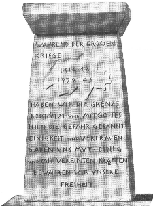
Das von Bildhauer Max Fueter geschaffene Projekt mit Beschriftung

-th. Zu den wenigen Städten und Orten, die bis heute noch kein Soldatendenkmal besaßen, gehört auch Bern. Endlich ist es aber soweit, daß der seit Jahrzehnten gehegte Wunsch der Aktivdienst-Veteranen 1914/18 in Erfüllung geht und auch die Bundesstadt an würdiger Stätte ihr Soldatendenkmal erhält. Kanton und Stadt Bern sowie die Bürgergemeinde auf der einen Seite haben sich mit den Initianten – fast alles Männer aus dem UOV Bern – andererseits, darauf geeinigt, die Gedenkstätte in die Anlage zwischen der Inneren und der Aeußeren Enge zu errichten, dort wo das Auge so weit über die Bundesstadt schweift, über der die Wälder und Hügel des Bernbiets grünen und der Horizont in der Ferne durch den Kranz der Berneralpen seine Begrenzung findet. Mit der Zusammenlegung der dafür zur Verfügung stehenden Mittel wurde gemeinsam ein beschränkter künstlerischer Wettbewerb ausgeschrieben, aus dem mit Erfolg der Bildhauer Max Fueter hervorging.