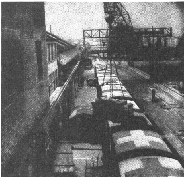
Trotz vermehrtem Ackerbau waren wir während des Zweiten Weltkrieges auf Importe angewiesen. Durch besonders gekennzeichnete Güterzüge versuchte man, diese Güter möglichst unversehrt zu erhalten

Für die Beschaffung der Gemüseportion, die zu Lasten der Haushaltungskasse bezahlt wurde, war eine Gemüseportionsvergütung vorgesehen, welche für Schulen 35 Rp. für übrige Truppen bei Standort bis 2000 m ü. M. 45 Rp. bei Standort über 2000 m ü. M. 60 Rp. betrug.