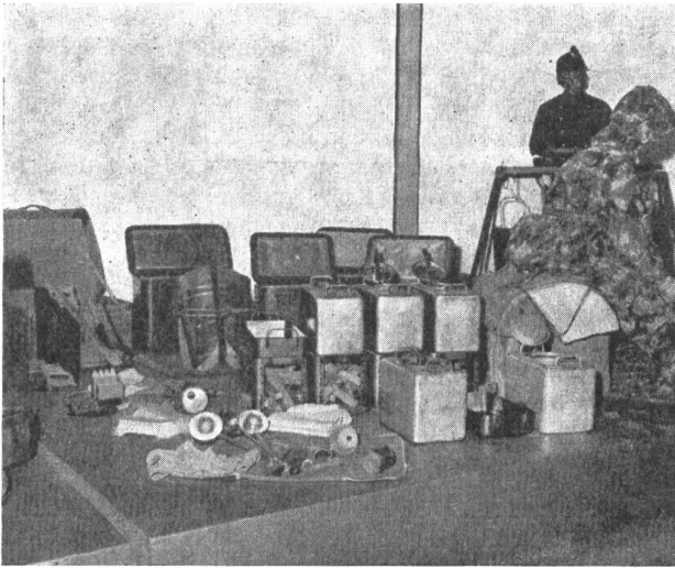
Kochkisten Mod. 1936

Es darf ohne weiteres behauptet werden, daß während des ganzen Aktivdienstes die Truppen mit der Verpflegung durchaus zufrieden waren. Dies ist umso wichtiger, als der Wehrmann damals infolge der strengen Rationierung sich kaum noch zusätzliche Nahrungsmittel beschaffen konnte.