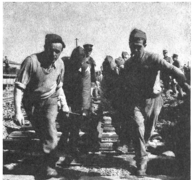
Die Soldaten der Armee helfen den Soldaten der Schiene

«Eine Armee ist nie am Ende ihrer Vorbereitungen; immer muß an der materiellen, geistigen und ausbildungsmäßigen Bereitschaft weiter gearbeitet werden, damit ein Angriff, wenn er plötzlich erfolgen sollte, uns möglichst bereit finden möge.»