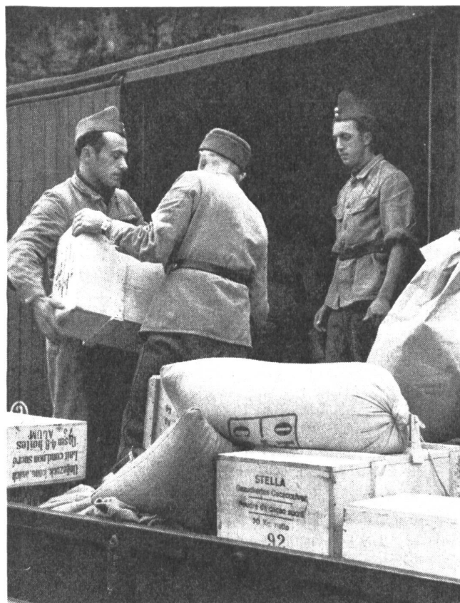
Unsere Transportanstalten stellten sich bei den Grenzbesetzungen für den militärischen Nachschub zur Verfügung.

* Hptm. Bühlmann: Kriegsmobilmachung 1914/19