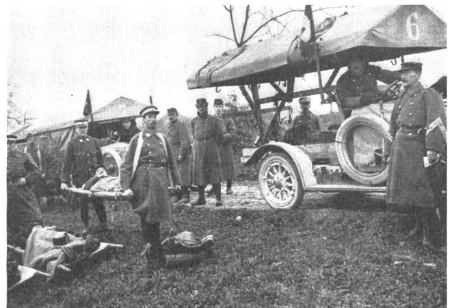
An den Felddienstübungen des Sanitätsdienstes nahmen schon früh die ersten Motorfahrzeuge teil

Bett nicht im Korridor hat». Das heißt, sie kann in ihrem abseitigen Zimmer ruhig leben, wenn die großen Nachbarn lärmend streiten. Nicht nur unser starkes Berggelände, sondern auch unsere zentrale geographische Lage, abseits der wichtigsten und günstigsten Operationslinien, hat wesentlich dazu beigetragen, daß wir außerhalb des allgemeinen Ringens blieben.