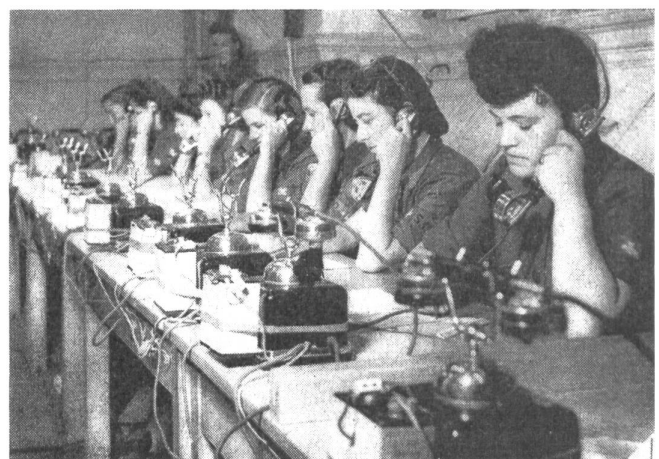
Blick in eine Auswertezentrale des Fliegerbeobachtungs- und Meldedienstes

Wenn wir die Lehren aus den zwei Grenzbesetzungen ziehen wollen, dann müssen wir erkennen, daß es zunächst auf die Einigkeit der Nation gegenüber der Bedrohung — sei sie nun größer oder kleiner — ankommt. Zum zweiten kommt es darauf an, daß unsere militärische Bereitschaft ein wirklicher Faktor darstellt, den auch die kriegführenden Mächte berücksichtigen. Die deutsche Führung verfügte im Zweiten Weltkrieg beispielsweise nie frei über die 12–20 Divisionen und Armeetruppen, welche zur Niederwerfung der Schweiz als erforderlich betrachtet wurden. Angesichts der Lage fühlte sie sich auch nie gezwungen oder verlockt, diese Divisionen freizumachen. So wird es auch in Zukunft sein müssen. Wir können darauf bauen, daß wir kein strategisches Ziel erster Ordnung sind. Ein primärer Angriff auf uns ist unwahrscheinlich. Er ist aber noch unwahrscheinlicher, wenn wir imstande sind, einem Aggressor einen starken und wirklichen Widerstand entgegenzusetzen. Muß er damit rechnen, so wird er wohl darauf verzichten, zusätzliche militärische Mittel für einen fragwürdigen Gewinn freizumachen. Solche Ueberlegungen sind keineswegs überholt. Sie spielen heute und in Zukunft. Wenn es uns gelingt, wie 14–18 und 39–45 gerade so stark zu sein, wie es die Lage verlangt, dann ist unsere Chance bedeutend, auch in einem vielleicht kommenden neuen Kriege unsere Unabhängigkeit mit den geringsten Opfern wahren zu können.