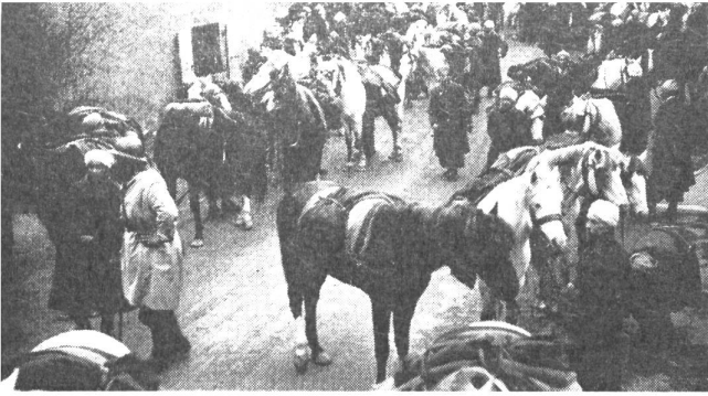
Unter den Verbänden des 45. französischen Armeekorps, das im Vorsommer 1940 in der Schweiz interniert wurde, befanden sich auch Spahis

Seine Schriften und Befehle zeigen, daß er erkannt hatte, worauf es für unser Heer ankam, nämlich auf die Festigung der Disziplin, die an manchen Orten so sehr fehlte und auf eine modernere zielgerichtete Ausbildung, die sich nicht in Drill und überalterten Gefechtsformen erschöpfte. Aber Willes Erkenntnisse und die Vorgänge in der Armee waren oft zweierlei. Die Form wurde vielerorts zum Selbstzweck und mit Drill suchte man die Zeit der langen Ablösungsdienste totzuschlagen. Wohl waren auch Fortschritte zu verzeichnen. Beispielsweise die zunehmende Marschtüchtigkeit der Truppe und anderes mehr, aber wie auch die Bewaffnung bis zum Schluß des Krieges lückenhaft blieb, fehlte es an wahrer Kriegstüchtigkeit allzuvieler Einheiten und Truppenkörper.