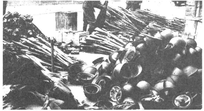
An der Grenze wurde die den Internierten abgenommene Bewaffnung zu Haufen geschichtet

Anders war die Lage 1939. Das Aufkommen der faschistischen Diktaturen hatte bereits vor dem Kriege den meisten Mitbürgern die Augen für die starke Bedrohung geöffnet, die auch unserm Lande gegenüber zutage trat. Eine neue Truppenordnung und neue Rüstungskredite waren angesichts dieser Lage noch kurz vorher gutgeheißen worden. Als der Krieg ausbrach, war das Schweizervolk sich einig, daß dem Druck der totalitären Staaten standzuhalten sei. Wohl gab es auch Momente der Schwäche, beispielsweise als im Mai 1940 die Deutschen überraschend nach Westen vorstießen und ihre großen Erfolge gegenüber dem starken Frankreich, gegenüber Holland und Belgien Zweifel an unserer Widerstandskraft aufkommen ließen. Aber auch dieses Gefahrenmoment wurde überwunden. Die Armee, die sich nach der Befestigungsperiode wieder der eigentlichen Ausbildung zuwenden konnte, gewann immer mehr an Selbstvertrauen. Die wirtschaftliche Sicherung der Familien trug viel dazu bei, daß die Wehrmänner sich konzentriert ihrem Dienst widmen konnten. Deutsch und Welsch waren sich einig in der Notwendigkeit der schweizerischen Einheit. Selbst die vorgesehene Preisgabe unseres Mittellandes an den Gegner, da die Kraft der Armee nicht ausgereicht hätte, dieses in einem Mehrfrontenkrieg zu behaupten, und der Bezug des Reduits hatte keine schwerwiegenden Folgen für den schweizerischen Abwehrwillen. Es war die Persönlichkeit