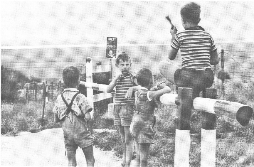
Hier endet die Freie Welt. Eine früher rege benutzte Straße nach Ungarn sperren Schlagbaum und verminte Drahthindernisse. Dahinter stehen alle 500 m die Wachtürme der kommunistischen Wächter.

vereint marschieren, bilden eine Gefahr für die Menschheit. Solange die Versorgung der Länder Afrikas, des Fernen und Mittleren Osten, vor allem Aegyptens und Indonesiens, mit sowjetischen Waffen nicht aufhört und die sogenannte Wirtschaftshilfe des Kommunismus auf politische Ziele ausgerichtet ist, kommen die vielen schwelenden Brennpunkte in der Welt, von denen jeder einzelne einen dritten Weltkrieg auslösen könnte, nicht zur Ruhe. Es ist eine Tragik, erleben zu müssen, wie ein Nehru in Indien, das durch die Rotchinesen akut bedroht ist, den Weg nicht findet, um mit dem benachbarten Pakistan den seit Jahren schwelenden Konflikt um Kaschmir zu begraben, während Pakistan mit Peking freundschaftliche Beziehungen unterhält und den Chinesen im Rahmen eines Luftfahrtabkommens sogar seine Flugplätze öffnet, unbeachtet der Tatsache, daß dieses Land Mitglied der SEATO ist. Das sind Fehlleistungen führender Politiker, die nicht sie allein, sondern wir alle vielleicht einmal teuer zu bezahlen haben.