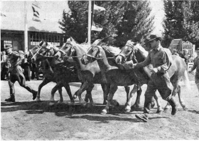
Pferdevorführung in der österreichischen . . .