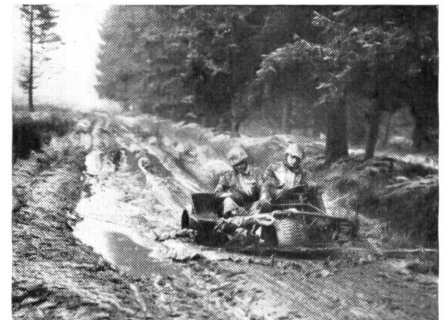
2 Selbst solche Wege meistert der «Westentaschen-Lastwagen» ohne Schwierigkeiten, angetrieben von einem Zweizylinder-Zweitaktmotor. Der Antrieb erfolgt durch beide Hinterräder, das Vorderrad dient zur Lenkung.