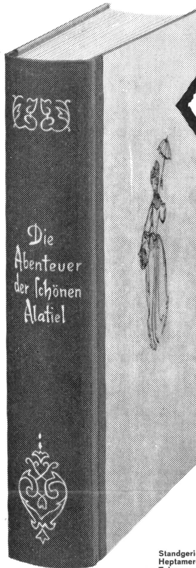
Mit echtem Lederrücken und echter Goldprägung

Behörden und Behördenvertreter, die verpflichtet sind, für geeignete Schießplätze zu sorgen, dürfen aus dieser Pflicht nicht ein Recht auf Erhaltung des bestehenden Zustandes um jeden Preis ableiten. Wer als Behörde aus Bequemlichkeit und Gewöhnung glaubt, jedes Eingehen auf Wünsche der Bevölkerung sei Schwäche, gehört nicht in eine Demokratie, sondern in eine Diktatur. Wer als Behörde patriotische Vereine vorschreibt, um die eigene Bequemlichkeit nicht