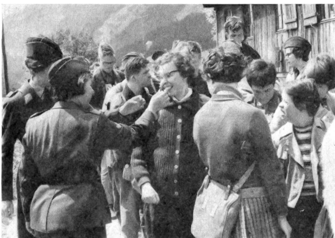
Freudig warten die Jugendlichen Schützlinge auf den Abmarsch. Versehen mit Znüni im Brotsack ziehen sie auf ein Entdeckungsreisli zum Stausee.

Das Wagnis eines Ferienlagers für geistig behinderte Jugendliche ist gut gelungen. Für die FHD war das Zusammen-