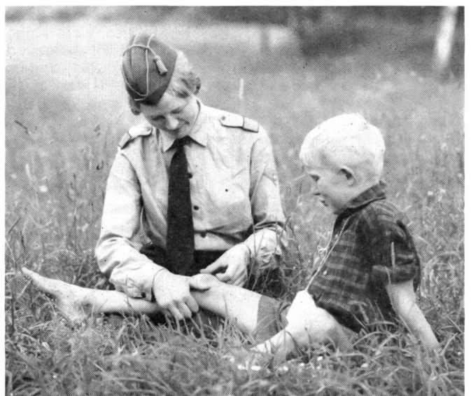
Ein richtiger Bub muß eine Schramme haben, aber wenn das FHD-Fräulein ein Pflaster darauf klebt, ist alles nur halb so schlimm.