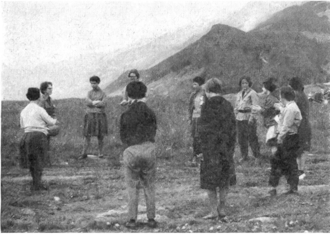
Im Ferienlager für geistig behinderte Jugendliche haben die Fürsorge-FHD eine dankbare Aufgabe übernommen.