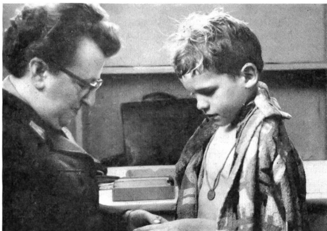
Sauberkeit ist erstes Gebot in einem Flüchtlingslager. Eine Aertzin kontrolliert die Kinder regelmäßig.

Jeder Leiter eines Jugendlagers weiß, wie schwierig es ist, am ersten Abend Ruhe zu gebieten. Mit sorgfältigen Bettgang-Zeremonien, mit dem pädagogischen Bettmümpfeli, einem Apfelstückli, gelang es in der Folge, für Nachtruhe zu sorgen.