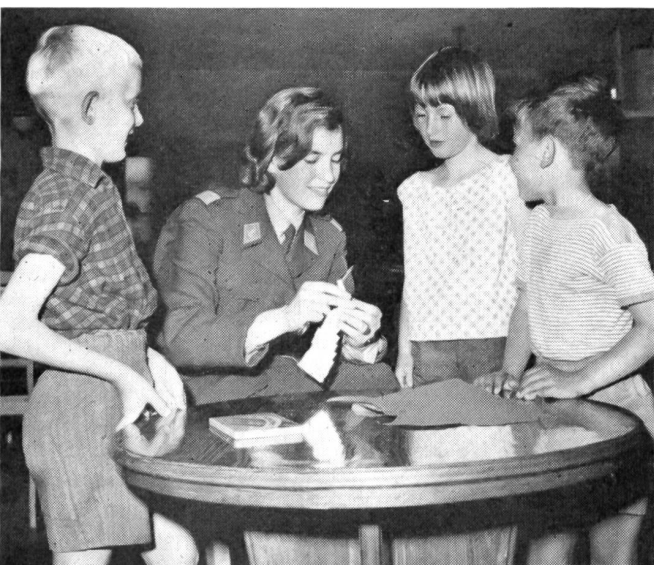
Mit Begeisterung sind die Kleinen und Kleinsten dabei.