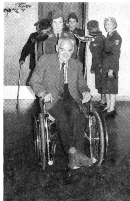
Aber nicht nur Kinder, auch alte Leute bedürfen besonderer Betreuung.