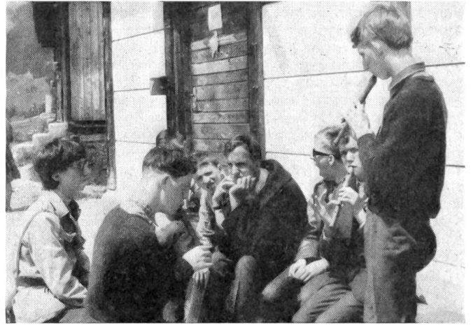
Beim Blockflötenspiel und Singen vor den Baracken in Brigels.

leben mit Hilfsbedürftigen, die steter Aufmerksamkeit bedürfen, anstrengend. Doch sie waren sich einig, es war für alle eine reiche Zeit.