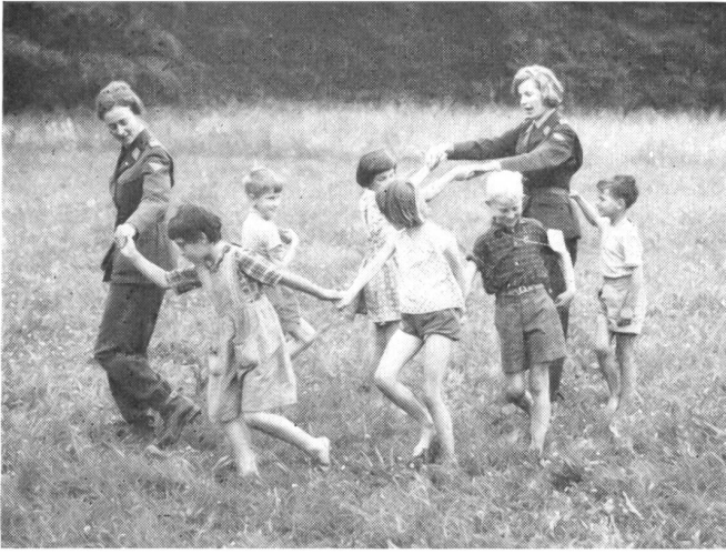
Nicht nur den Kindern, auch den Fürsorge-FHD macht zur Abwechslung ein Spiel im Freien viel Spaß.