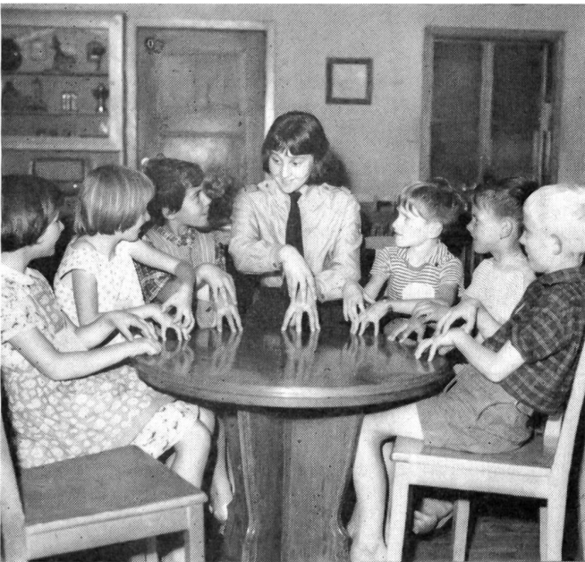
Daß hier eine Kindergärtnerin beim Fürsorge-Dienst wertvoll ist, sieht man den Kindern an.