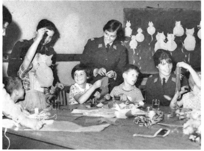
Kinder wollen zu jeder Stunde des Tages beschäftigt sein. Basteln von Spielsachen bringt Anregungen für die Kleinen.