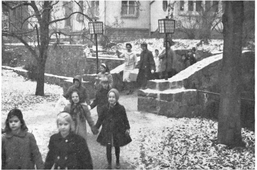
Waisenkinder gehen zu einer Weihnachtsfeier.