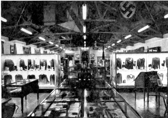
Im Museum der «Green Jackets Brigade» in Winchester gewinnt der Besucher einen interessanten Einblick in die mehr als 200jährige Geschichte dieser Truppe.

«The Green Jackets» kämpften dann 1808 unter General Wellington in Spanien, 1855 im Krimkrieg, 1899 in Indien (Omdurman), im Burenkrieg und schließlich im Ersten und Zweiten Weltkrieg. «Green Jackets» verteidigten 1940 Calais gegen eine große deutsche Uebermacht, um einen geordneten Rückzug aus Düнкirchen zu erlauben. Am 6. Juni 1944 landeten die «Green Jackets» als erste britische Stoßtruppen in der Normandie, als Truppenkörper der 6. englischen Luftlandedivision.