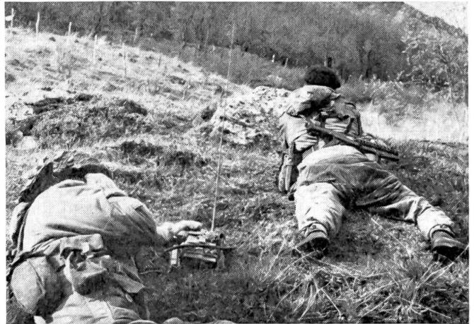
«Green Jackets» im Gefecht. Sie gehören zu den besten Scharfschützen der Armee. Sie waren auch die ersten britischen Soldaten, welche mit dem Gewehr ausgerüstet wurden.

1954 kämpften die «Green Jackets» in Kenya gegen die Mau-Mau und im gleichen Jahr gegen die kommunistischen Terroristen in Malaysia, und 1961 sorgten sie für Ruhe und Ordnung auf Cypern. Gegenwärtig befinden sich «Green Jackets» in Nord-Borneo, Deutschland, Berlin, Nordafrika und Hong-Kong. Noch heute zählen die «Green Jackets» zu den besten Scharfschützen der englischen Armee, und auch in der Öffentlichkeit genießen sie den Ruf, eine der besten Infanteriebrigaden zu sein. Der angenehme Dienstbetrieb und die einzigartige Möglichkeit, weit in der Welt umherreisen zu können, bewirkt, daß die «Green Jackets» keine Nachwuchsprobleme zu bewältigen haben.