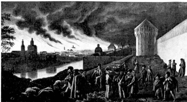
18. August 1812. Nachts um 10 Uhr an den Ringmauern von Smolensk. Hier kam es am 17. August zur ersten großen Kampfhandlung, an der 121 000 Russen und 186 000 Mann napoleonischer Truppen beteiligt waren. Die Schlacht endete mit der eiligen Flucht der Russen, nachdem sie alle Vorräte abtransportiert, die Bevölkerung evakuiert und die Stadt in Brand gesteckt hatten.

Die beigefügten Bilder stammen vom französischen General Ch. W. Fabre du Faur, der den russischen Feldzug als Oberleutnant der Artillerie mitgemacht hatte. Er brachte aus dem Kriege eine reiche Ausbeute an künstlerisch wertvollen Zeichnungen in die Heimat mit, die er an Ort und Stelle gemacht hatte.