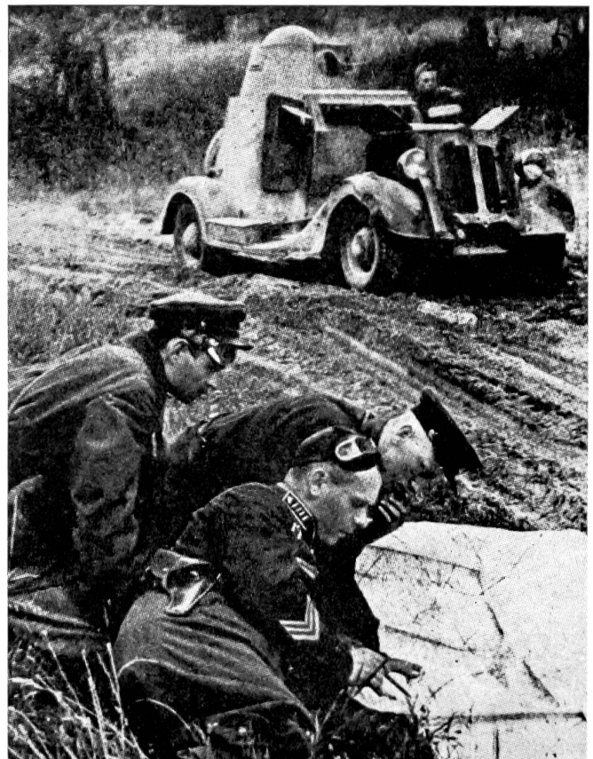
Offiziere der Roten Armee beraten sich während einer Marschpause (Juni 1941).

Die kürzlich erfolgte Einberufung von Reservisten sowie die abgehaltenen Manöver bezweckten die Ausbildung von Reserve-Einheiten sowie die Prüfung der Leistungsfähigkeit des Eisenbahnnetzes, und es ist zumindest absurd, diese Operationen als deutschfeindlich hinzustellen.»