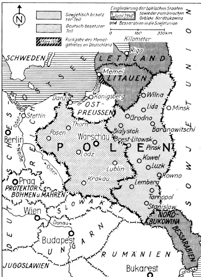
Die Erweiterung der sowjetischen Staatsgrenzen nach Westen zwischen 1939–1941.

Doch der Schein einer wolkenlosen deutsch-sowjetischen Freundschaft war bereits getrübt, obwohl Molotow in seiner Rede vom 1. August auch die deutsch-sowjetischen Beziehungen erwähnte und diese mit warmen Worten pries. Stalin hielt nämlich die Zeit für reif, die Sowjet-Expansion auch auf die Balkanländer auszudehnen. Er tastete nach Bulgarien und Rumänien, nicht zuletzt nach dem jahrhundertalten russischen Traum, dem Besitz der Dardanellen. Diese Aktivität mißfiel Hitler, der den Balkan als deutsches Interessengebiet betrachtete. Es kam daher vom 12. bis 14. November 1940 in Berlin zu einem Treffen zwischen Molotow und Hitler, wo die beiden Staatsmänner ihre Standpunkte für eine weitere reibungslose Zusammenarbeit darlegten. Doch sie sprachen aneinander vorbei: Molotow verlangte freie Hand für die UdSSR hinsichtlich des Balkans und Finnlands, Hitler und Ribbentrop sprachen von der Aufteilung «der Konkursmasse des bereits geschlagenen britischen Empires» und boten den Russen Gebiete von Indien und einen Zugang zum Persischen Golf an. Sie waren auch bereit, wenn Stalin seine weiteren Expansionspläne in Osteuropa aufgab, die Sowjetunion in ihr Bündnisystem («Dreimächtepakt»: Deutschland, Italien, Japan) aufzunehmen. So kam es in Berlin zu keinerlei Vereinbarungen, und als sich Stalin Ende November doch noch zu gewissen Zugeständnissen bereit erklärte und in