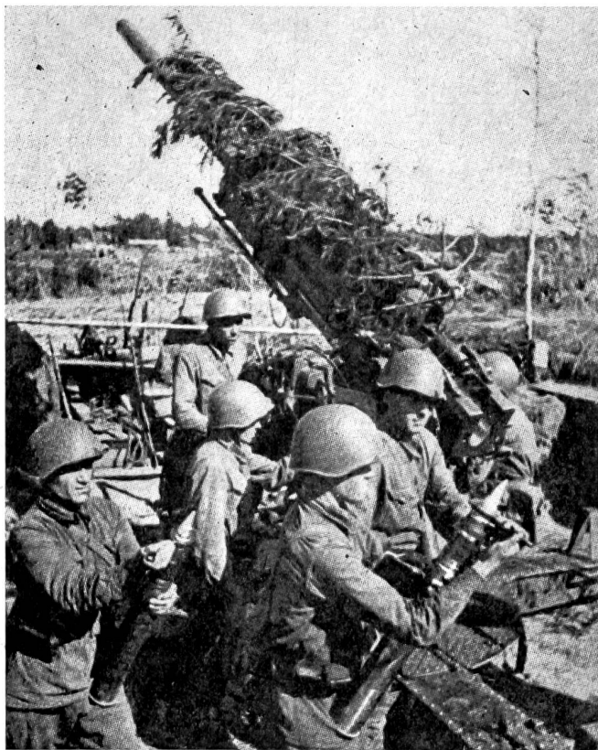
Flab-Batterie der Roten Armee im Juni 1941.

So verfügte die Rote Armee am Vorabend des Krieges wohl über 24 000 Panzer, doch das Gros war veraltetes Material. Die ersten Lieferungen der neuen Typen, die berühmten T-34 und die schweren Panzer «Kim Woroschilow», trafen erst im April und Mai 1941 in den bevorzugten Grenzmilitärbezirken ein. Insgesamt waren es jedoch nicht mehr als 1740 Stück. Schlimmer noch: viele Panzerfahrer verfügten bei Kriegsbeginn nur über eine eineinhalb- bis zweistündige Fahrpraxis. Auch hatten nicht alle Kommandeure die schwierige Kunst erlernt, Panzer- und motorisierte Verbände gemeinsam zu führen. Die sowjetische Luftwaffe mit 9000–10 000 mehrheitlich veralteten Maschinen wies große Mängel auf. Hinzu kam, daß die Umstellung des Mobilmachungsplanes von 1940 auf den von 1941 unvollständig war. Das Ausbildungsprogramm der Roten Armee sah für den Sommer 1941 überhaupt keine Vorkehrungen für einen Kriegsfall (auch nicht als Alternative!) vor, und die Truppen, die an Feldübungen teilnahmen, verbrauchten das ausgegebene Material mit der zentralen Parole: im Herbst erhalten wir sowieso neues! Trotzdem wuchs die Zahl der Divisionen der Roten Armee im Frühjahr 1941 im europäischen Teil der Sowjetunion ansehnlich. Während Stalin am 1. Januar 1939 über 100 Schützendivisionen, 32 Kavallerie-Divisionen und 24 motorisierte Brigaden