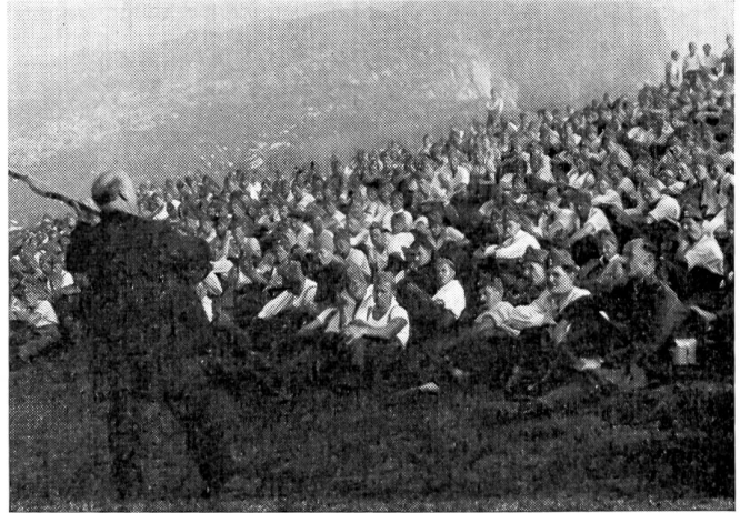
Hanns Indergand, der bekannte Sänger zur Laute, singt auf einer Paßhöhe für die Soldaten eines Gebirgsinfanteriebataillons.