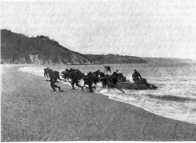
Marines sind in kleinen, beweglichen Gummibooten gelandet und stürmen auf eine Steilküste zu.