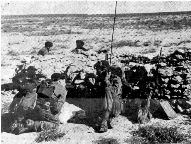
Royal-Marines-Kommandoposten mitten in der Wüste.