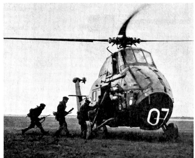
«Commando»-Soldaten gehen an Bord eines «Westland»-Helikopters. Zwei Flugzeugträger sind mit einer großen Zahl von Helikoptern ausgerüstet und verleihen so der Truppe eine große Beweglichkeit.