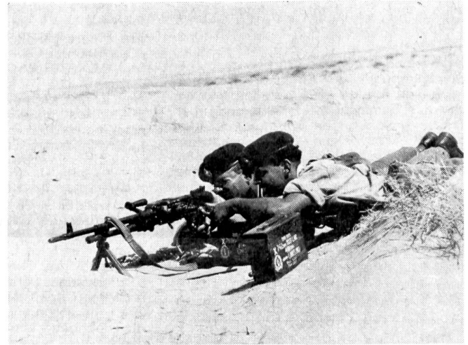
Zwei junge Mitrailleure hinter ihrem Maschinengewehr in der brennenden Sonne von Aden.