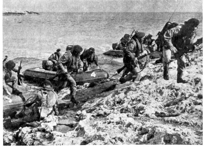
Die «Commandos» sind die Stoßtruppen der übrigen Landungstruppen. Sie führen kleine Handstreichs durch und greifen verteidigte Strandhindernisse an.