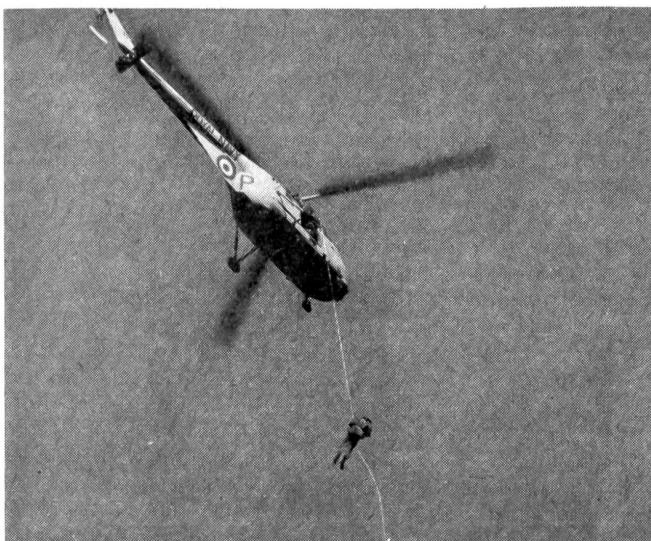
In den «Commandos» können nur ganze Kerle gebraucht werden. Auf dem Bilde seilt sich ein Marinefüsilier von einem Helikopter ab.