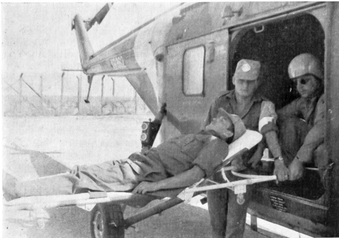
Versorgung von UN-Soldaten auf Cypern durch österreichische Sanitäter

Armee, die in der Weltpolitik nur Nebenrollen spielen. Oesterreich stellte einen Teil der Sanitätsdienste. Der Auftrag für das österreichische Sanitäts-Kontingent im Kongo war die Einrichtung und Führung eines Spitals für die Angehörigen der UNO. Die Realitäten zwangen aber zu Aufgaben, die weit darüber hinaus gingen: Betreuung von Flüchtlingslagern, Wie-