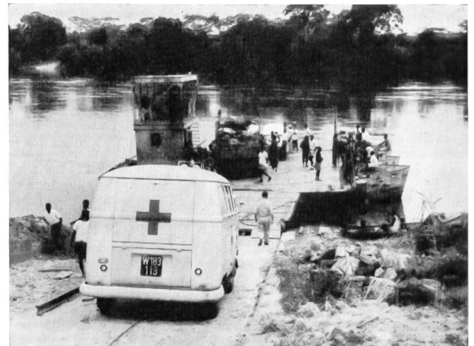
Ein österreichischer Sanitätstrupp unterwegs im Kongo