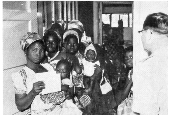
Behandlung der Zivilbevölkerung durch österreichische Sanitäter