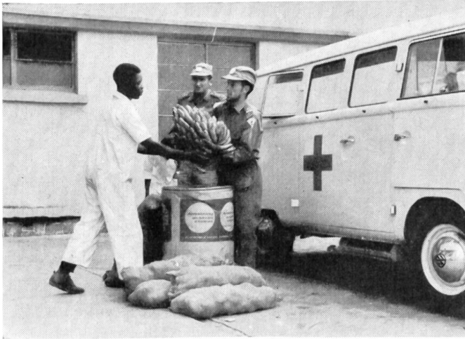
Verpflegung für die Bevölkerung im Kongo. Ausgabe durch österreichische Sanitäter.