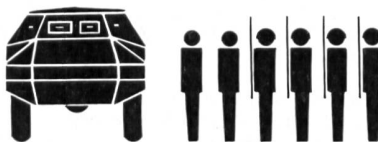
SCHÜTZENPANZERWAGEN BRDM (Bronewaja Raswedywatelnaja Dosornaja Maschina) (Schwimmfähig)