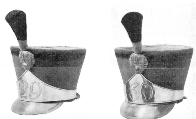
29e Rgt. suisse 1815–1828

Die 4 Schweizer-Regimenter hatten eine der übrigen Linien-Infanterie ähnliche, doch reichere Uniform. Der augenfälligste Unterschied bestand in dem Litzenbesatz auf der Brust und in den verschiedenen Abzeichenfarben. Der Czako war derselbe, der 1815 bei der Linien-Infanterie neu eingeführt wurde. Bei den Offizieren fehlten die Brustlitzen, dagegen waren 2 am Kragen angebracht.