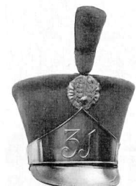
31e Rgt. suisse 1815–1828