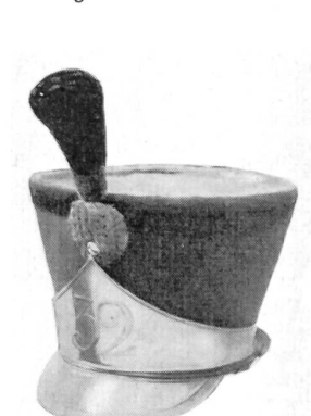
32e Rgt. suisse 1815–1828