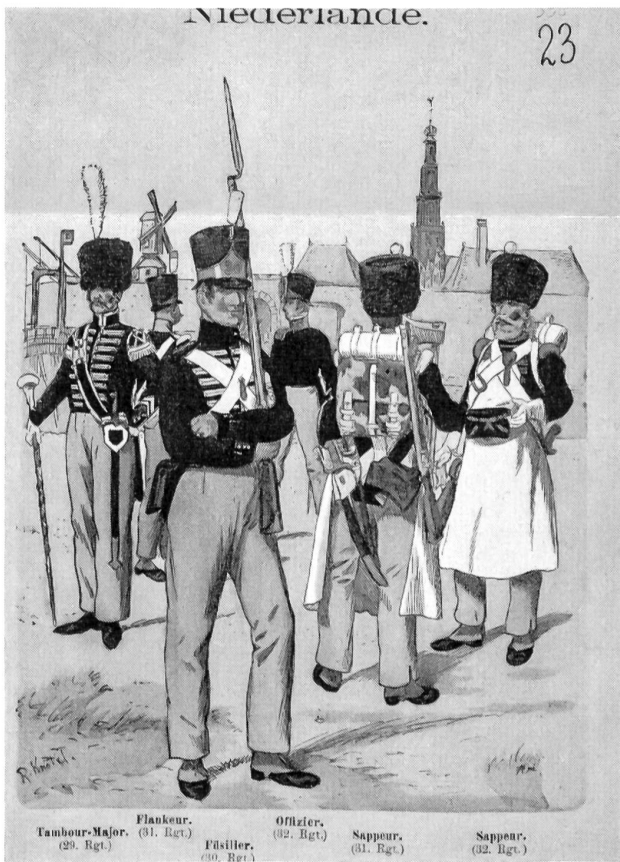
Tambour-Major. (29. Rgt.) Flanqueur. (31. Rgt.) Füsilier. (30. Rgt.) Offizier. (32. Rgt.) Sappeur. (31. Rgt.) Sappeur. (32. Rgt.)

Es wurden nur gesunde Rekruten zugelassen, die eine Größe von mindestens fünf Schuh, drei Zoll, rheinländisches Maß (= ca. 165 cm) aufwiesen. Tambours und Pfeifer waren von dieser Bestimmung ausgenommen. Sie konnten schon mit 16 Jahren in Dienst treten, sofern sie fünf Schuh groß waren (ca. 155 cm) und sich zwei Jahre länger als die anderen Diensttuenen verpflichteten.