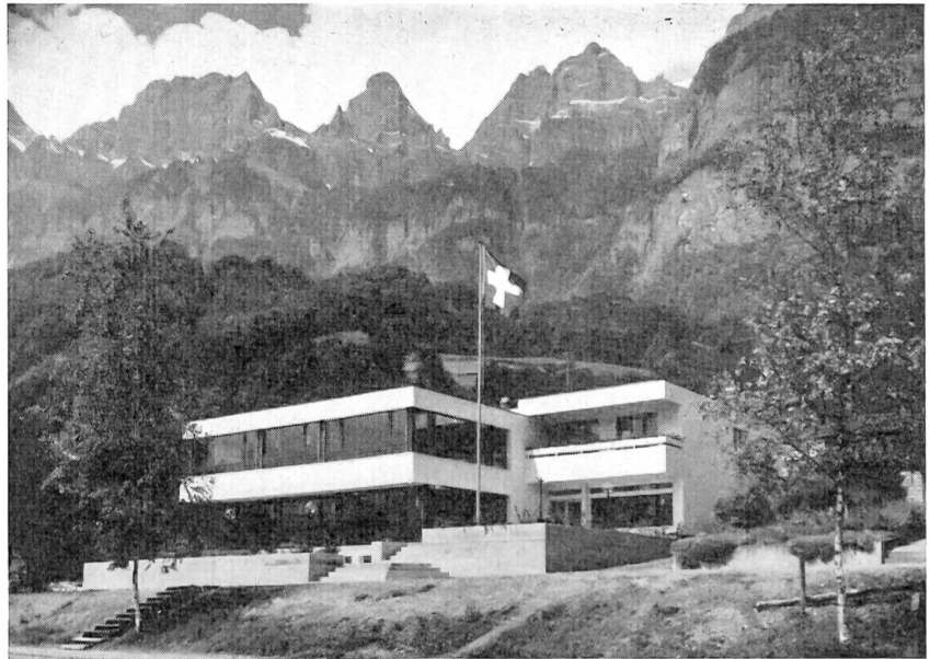
Dieses schucke Soldatenhaus des CVJM in Walenstadt ist am 21. Juni 1967 eingeweiht worden.

Im Sinn einer Uebergangsregelung für die Zwischenzeit bringt die Verordnung eine bereits in diese Richtung gehende Lösung, indem sie die bundesrechtlichen Bestimmungen über den Straßenverkehr als allgemeine Dienstvorschriften im Sinn der Art. 72 und 180 MStG erklärt und damit ihre strafrechtliche Beurteilung und damit ihre strafrechtliche Beurteilung der Militärgerichtsbarkeit zuweist. K.