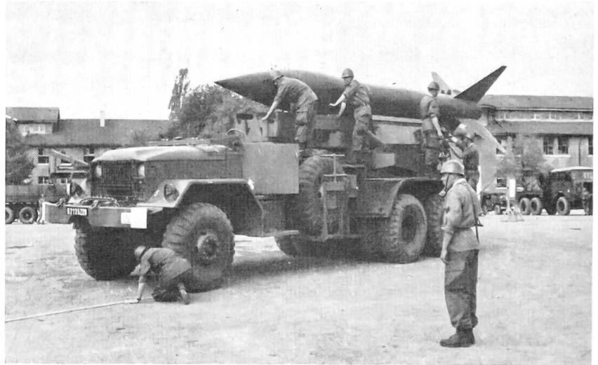
Die Bedienungsmannschaft einer «Honest-John»-Rakete beim Bereitstellen zum Abschluß.