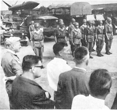
Die angetretene Bedienungsmannschaft mit ihrem Oblt. (links) vor dem Abschlußwagen einer «Honest-John»-Rakete.