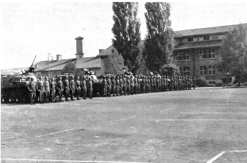
Ueberblick über einen Teil der angetretenen mech. Aufkl.Kp.

die Kdo. Gruppe mit dem Kp.Kdt. Stellvertreter, den Unterstützungszug, den Troß mit einem Zahlmeister als Führer und mehreren Fahrzeugen für die Verproviantierung der Kp. sowie die Kampfzüge, durchwegs mit den franz. AMX-Schützenpanzern ausgestattet. Ein Zug gliedert sich in vier Wageneinheiten und gilt als eigentliches Kampfelement, wobei im Gefecht der Abstand von einem Panzer zum andern ca. 400 m betragen dürfte. Die Fahrer, MG-Schützen der Panzer, die zugleich Wagenkdt. sind, wie auch die Unteroffiziere und Verbindungsleute, sind mit Maschinenpistolen ausgerüstet, die übrigen Mannschaften mit automatischen Karabinern und den zugeteilten leichten Maschinengewehren. Auffallen mußte uns Schweizern, daß keiner eine Stichwaffe, also ein Bajonett, mit sich führte. Dies