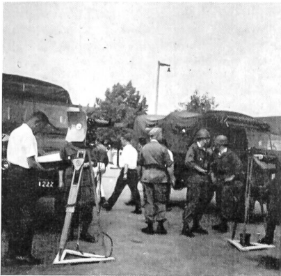
Vermessungs-Geräte und Mannschaften des «Honest-John»-Bataillons.