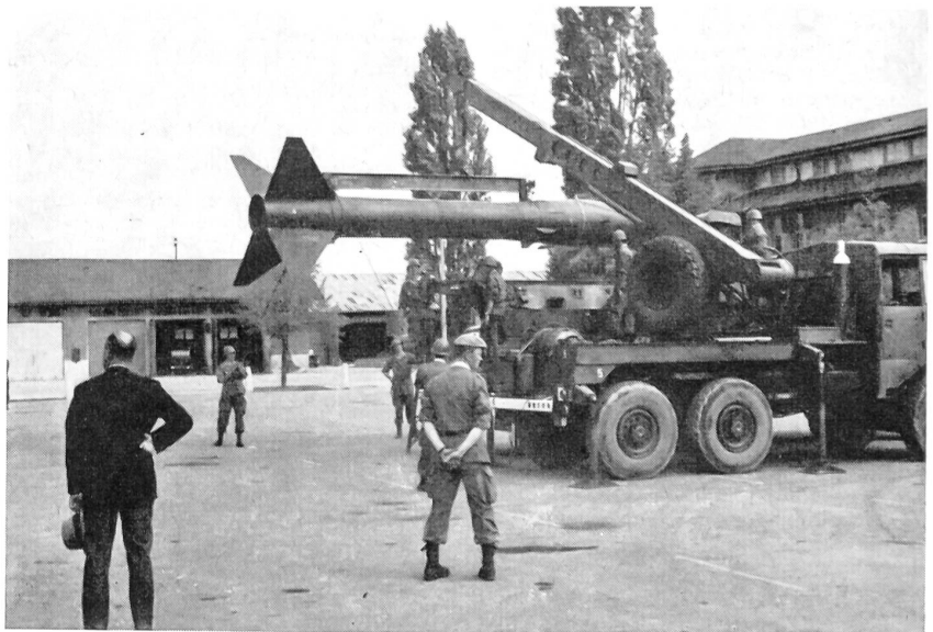
Eine montierte Rakete wird vom Kranwagen auf den Abschluß-Lastwagen befördert.