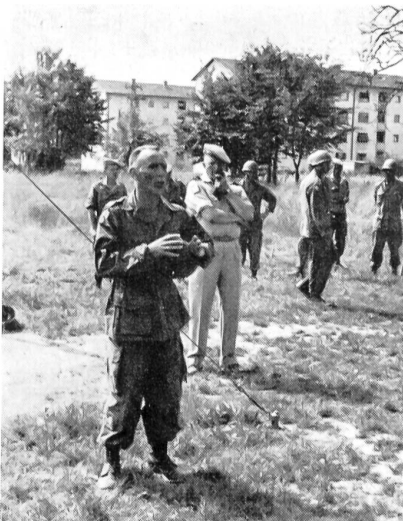
Ein Bild mit nachhaltiger Wirkung für uns schweizerische Unteroffiziere: Ein französischer Hauptmann und Kdt. einer Infanterie-Einheit hat soeben wie der letzte seiner Soldaten und Offiziere die Kampfbahn in einer Länge von einigen hundert Metern absolviert und erklärt nun, mit dem Helm unterm Arm, den Besuchern den Zweck dieses zweimaligen wöchentlichen Einsatzes. Rechts, weiter hinten, sehen wir den kommandierenden General der in Süd-deutschland stehenden französischen Truppen: Brigade-General Bouchard.