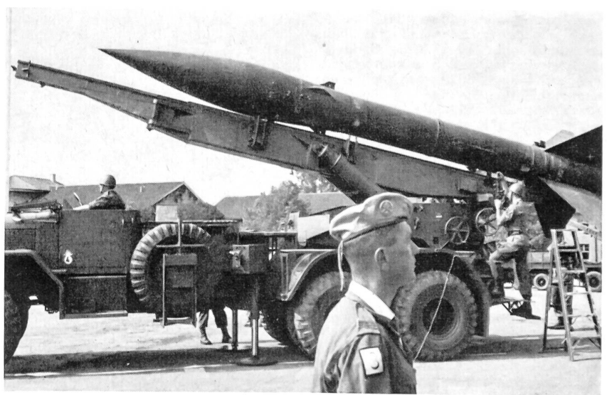
Der Abschlußwagen ist in Stellung, und nun wird die Rakete in den berechneten Abschlußwinkel gebracht.