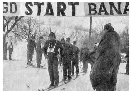
Am Start zum Patrouillenlauf

Der Unteroffiziersverein Baselland führt seit dem Jahre 1947 bei günstigen Schneeverhältnissen im Baseltaler Jura Militär-Skiwettkämpfe durch, die jeweils einen Ski-Einzellauf mit Handgranatenwerfen und Schießen, einen Patrouillenlauf mit Schießen und einen Riesenslalom umfassen. Anlaß zu diesen Wettkämpfen gaben die «Weißen SUT» 1946 in Davos. Daran beteiligte sich auch eine starke Patrouille des UOV Baselland, die sich im Partouillenlauf im ersten Range zu plazieren vermochte. Angesporn durch den Patrouillensieg wurde auf der Heimfahrt der Gedanke erwogen, eigene regionale Militär-Skiwettkämpfe zu organisieren. Nach eingehender Beratung war man sich einig: Ab 1947 werden jeweils alljährlich im verkehrstechnisch günstig gelegenen Läuelfingen am unteren Hauenstein Militär-Skiwettkämpfe durchgeführt. Wir müssen heute gestehen, die Wahl des Austragungsortes war nicht schlecht. Nicht schlecht deswegen, weil dort ein Gelände vorhanden ist, das jeder Anforderung gerecht wird, und weil in Läuelfingen und Umgebung ein Völklein wohnt, das die außerdienstliche Tätigkeit unserer Wehrmänner zu schätzen weiß und jeweils recht zahlreich die Wettkämpfe verfolgt.