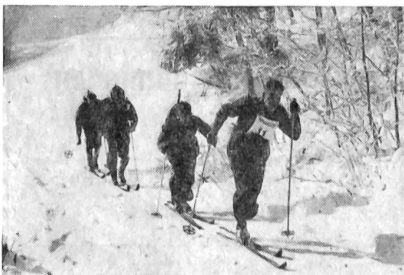
Eine Patrouille im Aufstieg