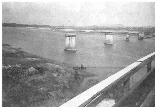
Ist es nicht symbolisch, daß diese «Friedensbrücke» (wie ihr richtiger Name ist) noch immer nicht wieder instandgestellt wurde?