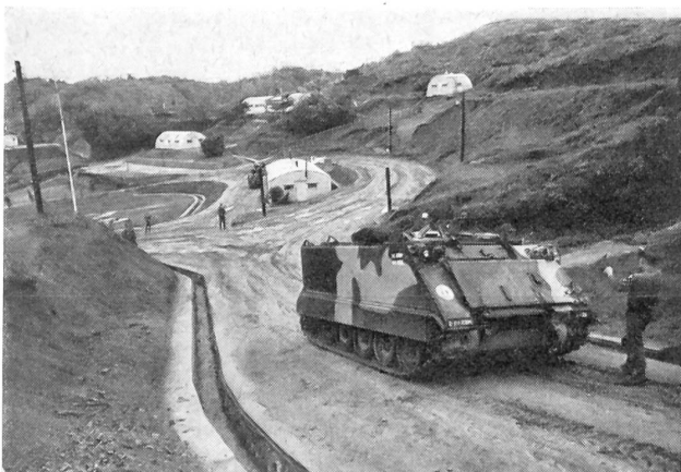
Rund um diese Soldaten und den Tank war die Gegend absolut «friedlich». Aber das hält die Truppe nicht davon ab, scharf auf jede Bewegung im Gelände zu achten.