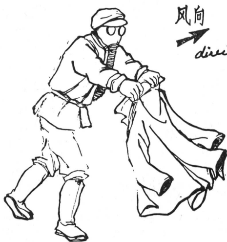
图一 抖拂法 en secouant