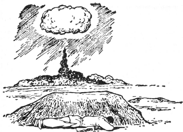
图一 卧倒在土坨后面