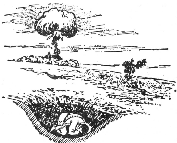
图三 卧倒在弹坑内