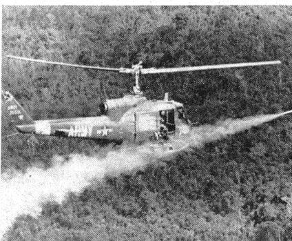
Eine UH-1B der US Army im Kampfeinsatz in Vietnam. Seitlich des Rumpfes sind Raketenwerfer installiert.

Die Bell UH-1 wird gegenwärtig bei mehr als 30 Nationen eingesetzt. Für die US Army lieferte Bell bisher über 5000 Iroquois.