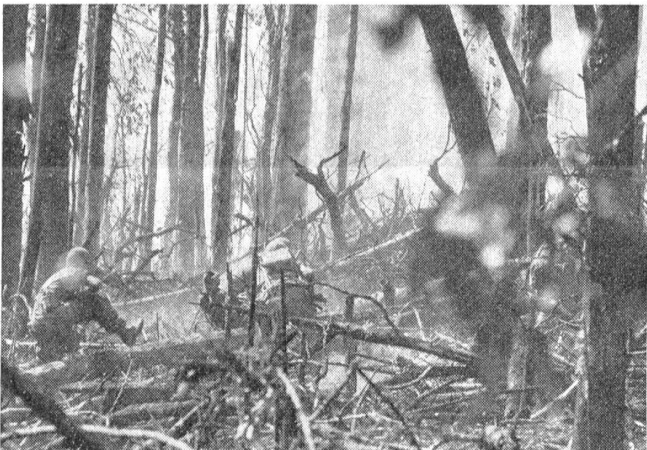
Schweiß und Blut kostete der Angriff durch das zerhackte Gelände.