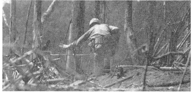
Der Feind ist überall.