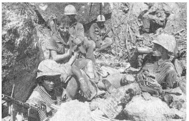
Höhe 875 im Besitz der Amerikaner.