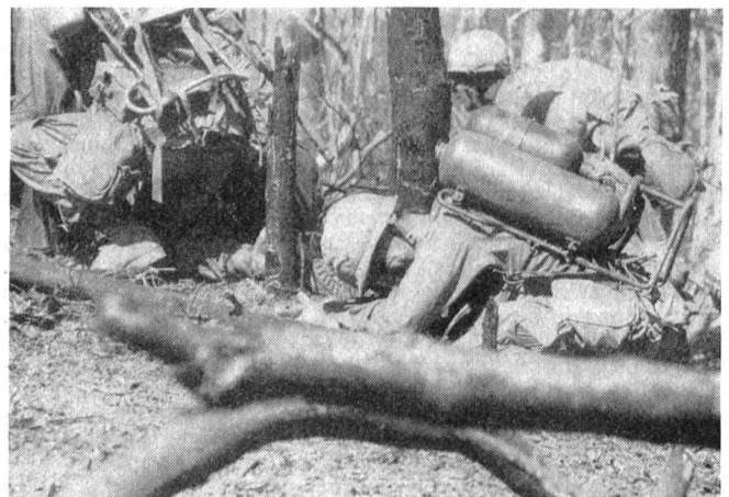
Gezieltes Feuer aus Automaten nagelt die Angreifer fest.