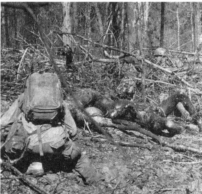
Fürchterlich wirkten die Napalmbomben unter den Verteidigern.