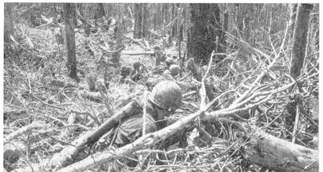
Fallschirmjäger der 173. Kompanie vor dem letzten Sprung.