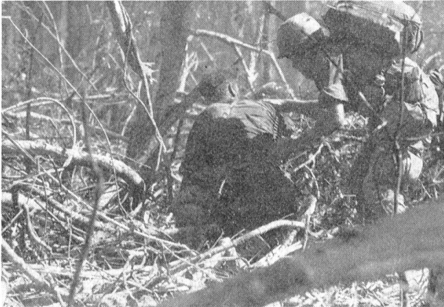
In aller Eile wir ein verwundeter Kamerad versorgt.