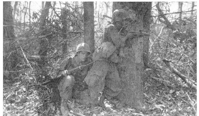
Kurze Atempause vor dem entscheidenden Sturm.