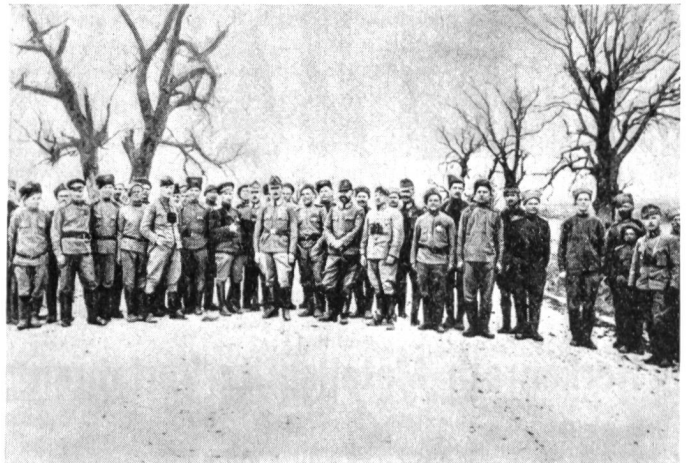
Die Fraternisierung ungarischer und russischer Soldaten an der Ostfront 1917.

Auch auf aussenpolitischer Ebene erlitt die Károlyische Politik einen Schiffbruch. Die Westmächte, voran die Franzosen, betrachteten Ungarn als Nachfolger der Donau-Monarchie, wobei der Oberbefehlshaber der französischen Truppen auf dem Balkan, General Franchet d'Espérey, den bei ihm in Belgrad erscheinenden Károlyi trotz dessen Unterwürfigkeit ablehnend und barsch behandelte. Inzwischen gerieten auch die Grenzen Gross-Ungarns ins Wanken. Nach den Kroaten sagten sich die Siebenbürger Rumänen, danach die Slowaken von Budapest los. Vergebens waren die enormen Bemühungen der Emissäre der Károlyi-Regierung — weder der eine noch der andere konnte die Nationen zu einem anderen Entschluss als zur Loslösung von Budapest bewegen. Die Armee zerfiel. Und wer unter den Soldaten noch für das Land kämpfen wollte, wurde von Károlyis Kriegsminister,