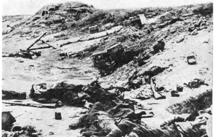
Die Höhe 534 in den Karpaten. Schauplatz der erbittertesten Kämpfe des Ersten tschechoslowakischen Korps

nützen verstand. Schliesslich wurden seine Bemühungen auch von unseren wesentlichsten politischen Repräsentanten unterstützt, die mit Gottwald an der Spitze eine Woche lang bei uns zu Besuch weilten.»