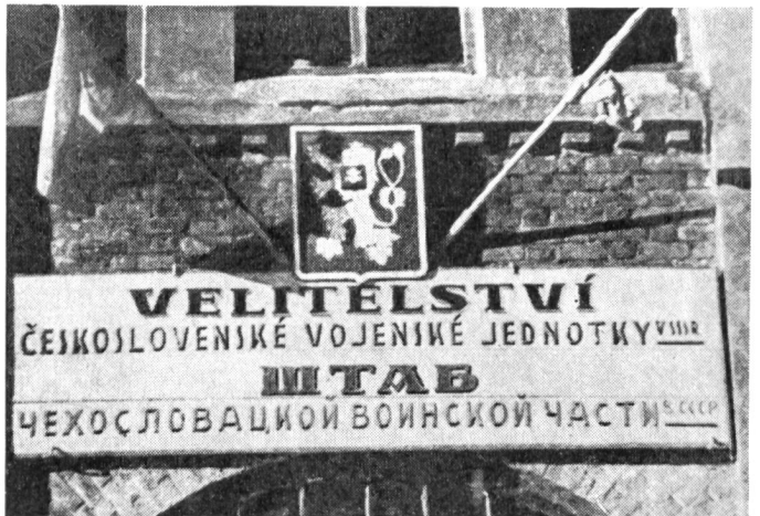
Das Stabsgebäude des Ersten tschechoslowakischen selbständigen Feldbataillons in Buzuluk

Zur Durchführung dieser Evakuierung, aber auch mit politischen Aufgaben betraut, reiste im Mai 1941 eine kleine Gruppe tschechoslowakischer Offiziere von London nach Moskau, die sich dann nach dem 22. Juni 1941 in eine offizielle tschechoslowakische Militärmision umwandelte. An ihre Spitze wurde Oberst Heliodor Pika gestellt, und als in London am 27. September 1941 ein tschechoslowakisch-sowjetisches Militärabkommen abgeschlossen wurde, das die Zusammenarbeit der beiden Länder gegen Deutschland regelte, bestimmte Artikel 3 dieses Abkommens die