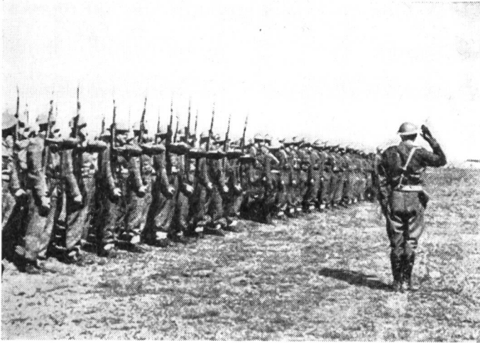
Appell in Buzuluk. Das Bataillon trägt Uniformen nach englischem Schnitt.

slawischen Bruder» Asyl. Schreckliche Enttäuschungen erwarteten sie: Kaum hatten sie die Grenzen der UdSSR überschritten, wurden sie wegen «illegalen Grenzübertrittes» von der NKWD festgenommen und im Schnellverfahren als «Diversanten» und «Agenten der Bourgeoisie» summarisch zu 25 Jahren Zwangsarbeit verurteilt. Die jungen Männer wurden im Winter 1939/40 nach dem nördlichsten Teil der Sowjetunion, dem Franz-Joseph-Land, deportiert und in verschiedene Konzentrationslager gesteckt, in denen sie bei enormen Entbehrungen leichte Beute des Todes wurden.