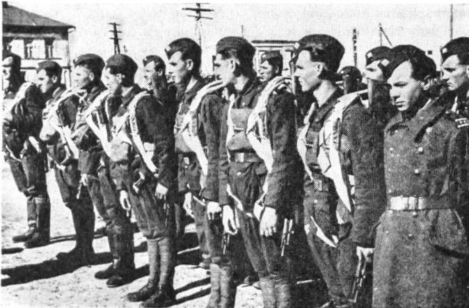
Die Zweite Fallschirmjäger-Brigade des Ersten tschechoslowakischen Korps in der Sowjetunion bereitet sich für den Einsatz vor