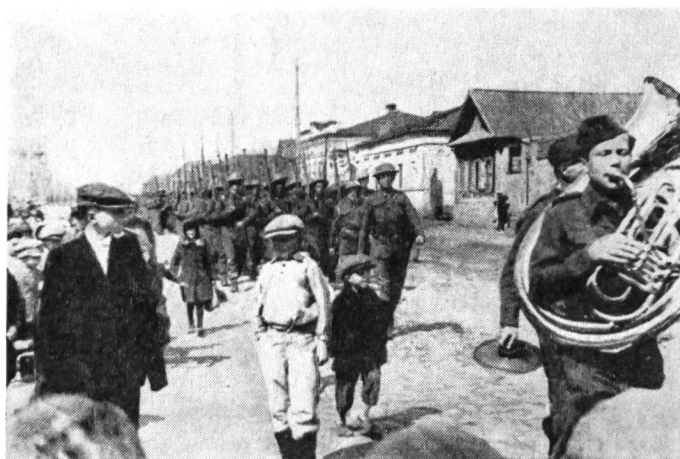
Die 1.-Mai-Feier in Buzuluk. Aufmarsch des Bataillons.

Da der Mangel an Offizieren stets akuter wurde und General Ingr nur mit Widerwillen Männer aus dem Unteroffizierskorps — ohne ausreichende Schulen — zu Offizieren befördern wollte, schickte man aus London aus der dortigen tschechoslowakischen Militärformation Offiziere in die Sowjetunion. Diese Tschechen und Slowaken fanden in mancher Hinsicht missliche Zustände bei den Truppen in der Sowjetunion vor, besonders hinsichtlich der russischen Verbindungsstäbe. «Diese „Offiziere“ waren brutal und primitiv. Es kam öfters vor, dass manche von ihnen überhaupt keine Militärkarte lesen konnten», erinnert sich ein heute in London lebender ehemaliger tschechoslowakischer Hauptmann an diese Zeit. Aber die Antipathie schien gegenseitig zu sein. Der schon erwähnte Theodor Fis, im Jahre 1943 bereits Unterleutnant und eine der Ordonnanzen Svobodas, schreibt in seinem Buch über die «Londoner Offiziere» wie folgt: