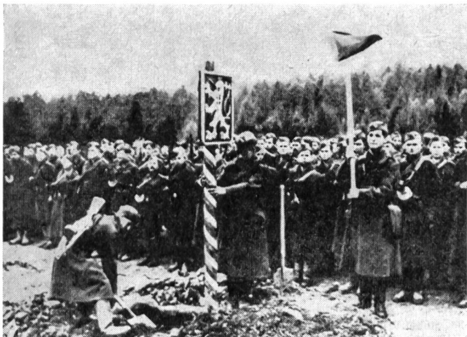
Wieder zu Hause. Im Herbst 1944 erreichten die tschechoslowakischen Soldaten ihr Land und markierten die alte Grenze mit dem Staatswappen.

wurde indessen am 9. Mai 1945 von russischen Truppen «befreit». Die tschechoslowakischen Soldaten zogen erst am 17. Mai in der Hauptstadt ihres Landes ein, wo sie mit grossem Jubel empfangen wurden. Jene Einheiten, die für die Unabhängigkeit und Freiheit des Landes auf westlicher Seite gefochten hatten, kamen nur einige Tage später nach Prag und wurden dann in die neue, nunmehr von General Svoboda geführte tschechoslowakische Armee eingegliedert.