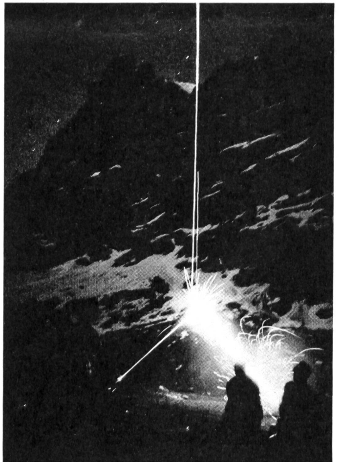
Zwei Mg 64 und ein 8,1-cm-Minenwerfer in kombiniertem Einsatz