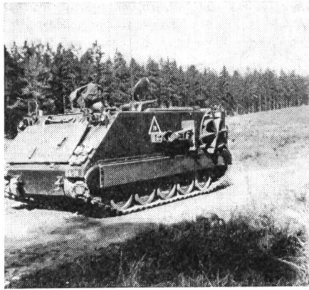
Spz MTW M-113

Der Sicherungsdienst an der Grenze erfolgt in vielfältiger Weise und wird mit beträchtlichem Aufwand betrieben. Von den drei Kompanien des Bataillons steht jeweils eine turnusweise im Grenzsicherungsdienst, der sowohl Jeep-Streifen mit zwei Wagen als auch die Besetzung ständiger Posten, sogenannter «Observation Points», etwa zwei bis drei je Bataillonsabschnitt, umfasst. Dies sind gesicherte Beobachtungsstellen, die je nach dem Gelände unmittelbar in Grenznähe oder an geeigneten anderen Stellen, die eine Übersicht bieten, angelegt sind. Diese Posten haben Kabel- und Funkverbindung zum Bataillon