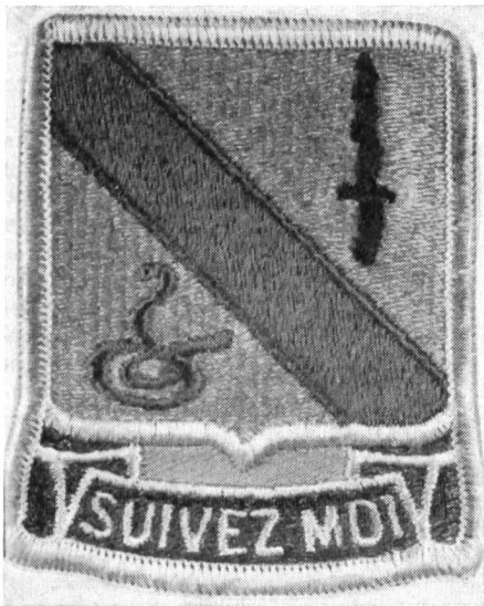
Regimentsabzeichen 3rd Bn, 14th Armored Cavalry Regiment

Die in der Bundesrepublik liegende 7. US-Armee hat in ihrem Grenzbereich gegenüber der DDR und der CSSR korpsunmittelbare Einheiten stationiert, deren vorwiegende Aufgabe die Grenzsicherung ist. Es sind dies die sogenannten Panzerkavallerieregimenter, die in ihrer Bezeichnung noch den traditionsbedingten Hinweis auf die Kavallerie führen. In der amerikanischen Armee gibt es derzeit nur