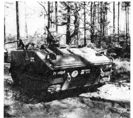
L Spz M-114