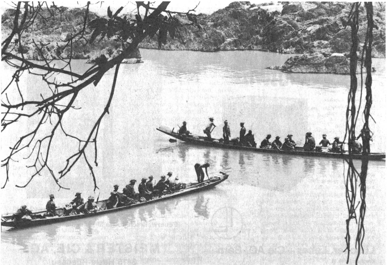
Laotische Regierungstruppen auf primitiven, von Eingeborenen gebauten Flussbooten.

gegen kommunistische Nachschublinien und Stellungen in der «Ebene der Tonkrüge». Amerikanisches Kriegsmaterial trifft in Vientiane ein, um die sträflich vernachlässigten Regierungstruppen aufzurüsten. Ob es Souvanna Phouma gelingt, die ernste Lage zu meistern, wird schon die nächste Zukunft weisen.