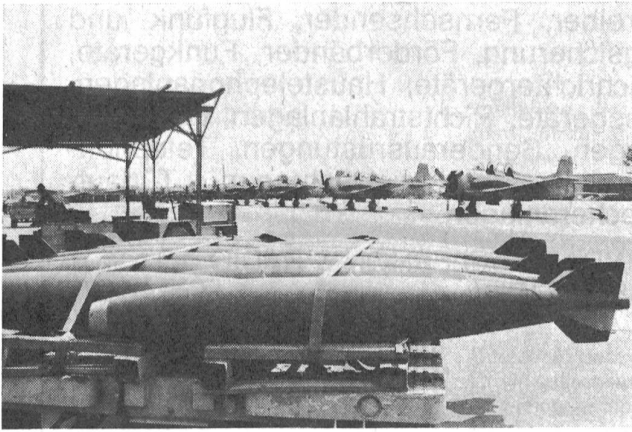
Waffen, Munition, Bomben und Flugzeuge treffen auf dem Flugplatz von Vientiane ein.