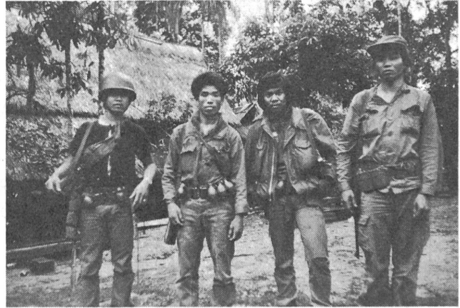
Typen laotischer Regierungstruppen bei Pakou.

Offensichtlich zählt Prinz Souvanna Phouma jetzt, nach dem Scheitern seiner Neutralitätspolitik, auf amerikanische Unterstützung. Doch Präsident Nixon, im Begriffe, die US-Truppen aus Vietnam abzuziehen, kann und will keinen neuen Landkrieg führen. Hingegen fliegen amerikanische Bomber rollende Einsätze