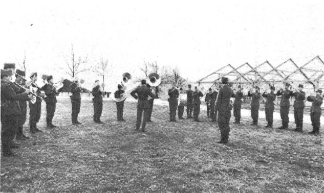
Gesamtübung. Ein jedes Musikstück wird von Grund auf einstudiert, bis es «sitzt».