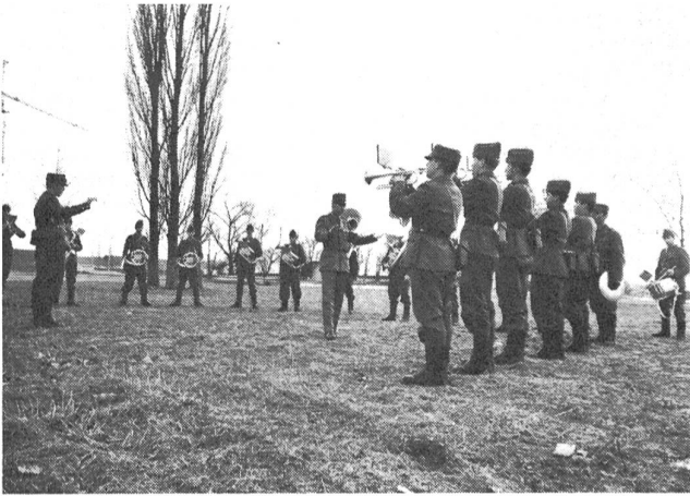
Registerübung mit dem «kleinen Blech», d. h. den Trompeten.