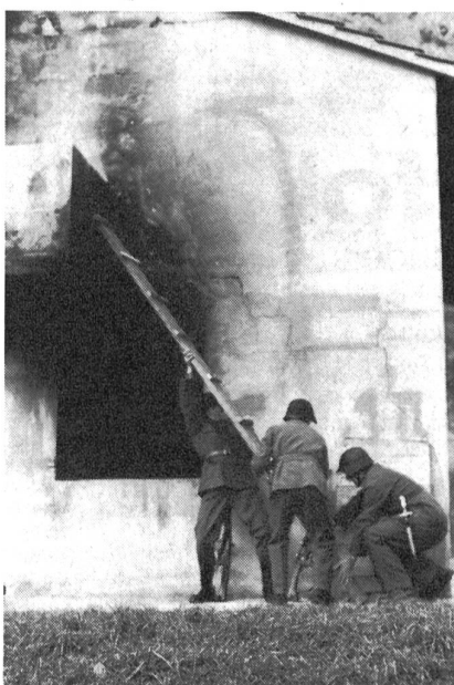
Grundsatz im Ortskampf: Räumen von oben nach unten — also Einstieg über den Balkon

Auf dem ganzen Areal lassen sich aber auch viele andere Ausbildungsthemen durchexerzieren. Die Trümmerpiste und die Wassergräben sind bestimmt gute Voraussetzungen zur Anlage von sogenannten Überlebenspisten (AC-Ausbildung, Kameradenhilfe) und dienen wohl gleichzeitig als Nahkampf- und Körpertrainings-Par-