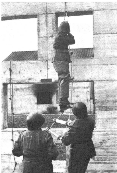
Übung mit der selbstverfertigten Strickleiter an der Übungsfassade

Die verschiedenen Bauten und Einrichtungen erlauben die Anlage eines idealen Zugsarbeitsplatzes. Das robuste Brandhaus, das unterkellert ist und sogar einen Fluchtweg besitzt, bietet sehr gute Voraussetzungen für alle mit der Bewachung und der Verteidigung von Objekten zusammenhängenden Übungen. Der Angriff auf ein Objekt kann in idealer Weise geübt werden, und zwar ohne Rücksicht auf Beschädigungen und ihre Folgen. Der nahe Wald bietet zudem eine günstige Gelegenheit für eine gefechtstechnisch richtige Annäherung an eine Ortschaft oder an ein einzelnes Gebäude. Neben dem Brandhaus stehen einzelne massive Fassaden. Hier können Details, wie richtiger Einstieg durch Fenster, die Verwendung von Hilfs-