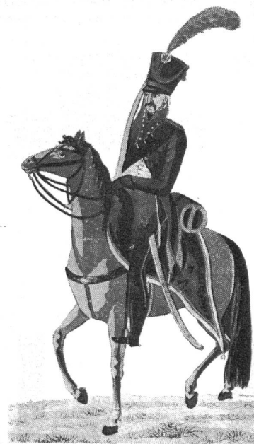
Alte Schweizer Uniformen 22

Im Rahmen einer Phänomenologie des Krieges, die den Gründen und Ursachen dieser langen Dauer moderner Waffen-