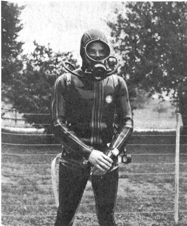
Ein vollständig ausgerüsteter Taucher