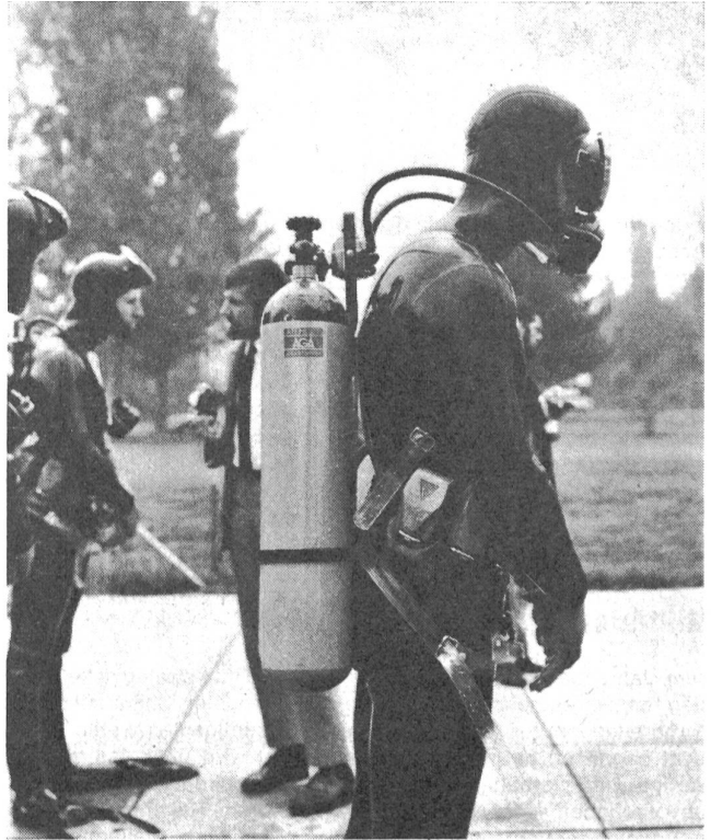
Der gleiche Taucher wie auf Bild 1, diesmal von der Seite. Beim mitgetragenen Atemgerät handelt es sich um ein Pressluftgerät. Deutlich sichtbar die am Gürtel mitgeführten Bleigewichte, die das Verbleiben unter Wasser erleichtern.