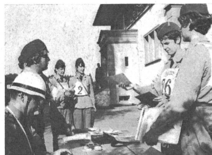
Befehlsausgabe auf dem Posten beim Schulhaus Iffwil. Die Equipen nehmen ihre Prüfungsaufgaben entgegen, die innerhalb eines bestimmten Zeitraums gelöst werden müssen.

Seit Ende des Zweiten Weltkrieges ist uns — ausser der deutschen Bundeswehr — keine Armee bekannt, die des Dienstes von Frauen und Mädchen entraten könnte. Die Erkenntnis, dass der Einsatz weiblicher Dienstwilliger die entsprechende Zahl Wehrmänner für den Kampf freigibt, ist hierzulande während des Aktivdienstes gewonnen worden, wobei nicht verschwiegen werden soll, dass die Idee zur Einführung des Frauenhilfsdienstes nicht etwa von der Armee, sondern von tüchtigen und weitblickenden Frauen ergriffen worden ist.