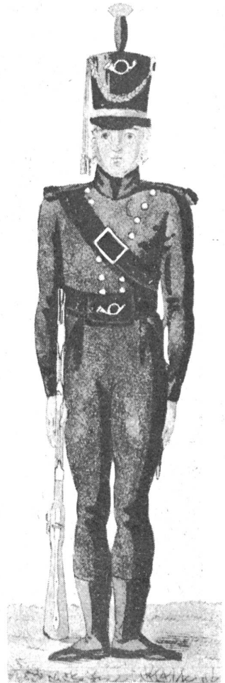
Alte Schweizer Uniformen 11