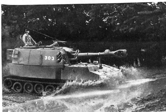
Das Leitgeschütz der Pz Hb Btr III/10 auf der Fahrt von der Lauer- in die Feuerstellung auf der «feuchten» Allmend von Bière.

Die schwere Artilleriemunition kann infolge ihres Gewichts kaum mehr von Hand verschoben werden. Die modernen Henschel-Lastwagen der Dienstbatterie verfügen aber über hydraulische Hebevorrichtungen, so dass der Umlad (wie hier von der Bahn auf Lastwagen) der palettierten Munition reibungslos vor sich gehen kann.