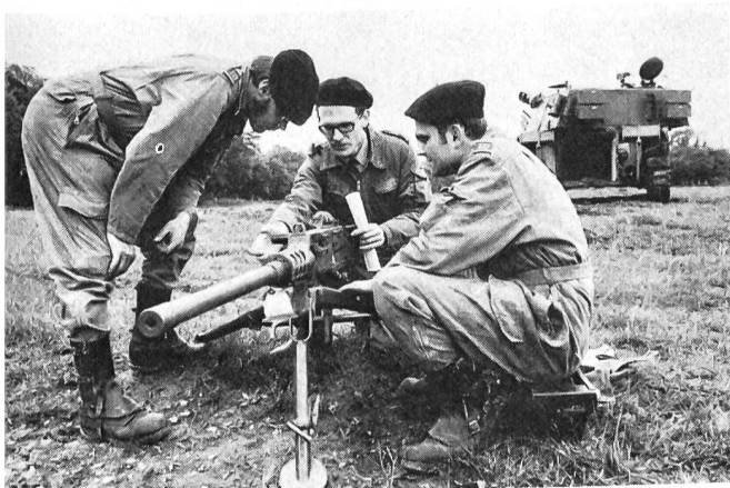
Ausbildung an einer den Artilleristen bisher unbekanntem Waffe, dem schweren 12,7-mm-Maschinengewehr. Mit dieser Waffe ist jedes Raupenfahrzeug der Geschütz- und Feuerleitbatterie ausgerüstet.