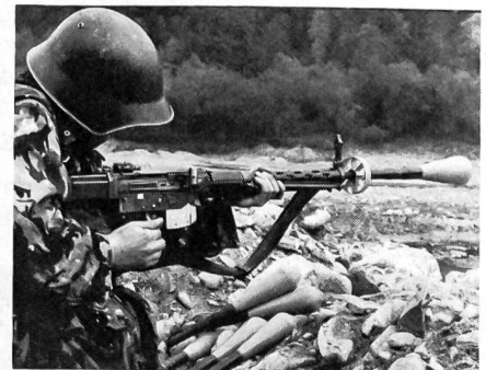
Beim Schiessen von Panzerwurfgranaten beim Schlierensammler.

phasen umfassten den gefechtsmässigen Anmarsch der Züge, den Kampf im Hinterhalt und Sperren auf Gegenseitigkeit, den gefechtsmässigen Einsatz von Helikoptern und deren Bekämpfung, einen AC-Parcours sowie das Panzerabwehrschiessen mit Bewertung. Die Gliederung der Züge zeigte einen Zugführer, einen Zugstrupp, zwei Füsiliergruppen, eine Panzerabwehrgruppe sowie eine Mitrailleurguppe. Gäste aus nah und fern, vor allem die Militärdirek-