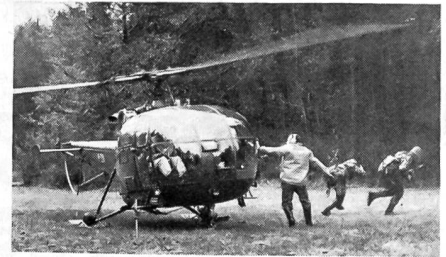
Absetzen eines Helikopters, in dem Kampfsoldaten transportiert wurden, am Gerzensee.

Am Samstag, 16. Oktober, führte der Zentralschweizerische Unteroffiziersverband eine Felddienstübung durch, die von 185 jüngeren Unteroffizieren aller Waffengattungen sowie von 50 Offizieren erfolgreich bestritten wurde. Zweck der Übung war die Schulung der Kader für den Jagdkrieg unter Einsatz moderner Hilfsmittel. Die jungen Unteroffiziere sollen für die ausserdienstliche Tätigkeit begeistert werden. Überdies galt die Übung auch der Pflege der Kameradschaft zwischen Unteroffizieren und Offizieren. Uri, Einsiedeln, Zug, Stadt Luzern, Nidwalden I und II sowie Obwalden I und II stellten verstärkte Gefechtszüge. 16 Motorfahrzeuge, 2 Panzerattrappen, 4 Helikopter und 2 Kanonenboote gelangten zum Einsatz. Die Übungs-