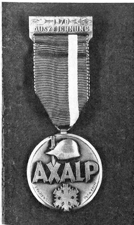
5. Militär-Skitage Axalp 23. und 24. Januar 1971

Kameraden, reserviert euch dieses Datum zum Besuche dieser gelungenen Veranstaltung.