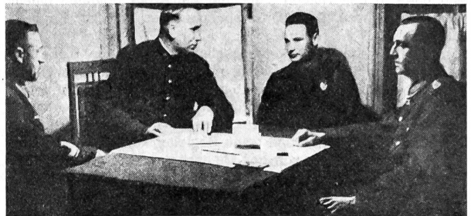
Das erste Verhör des Generalfeldmarschalls. Am Tisch in der Mitte: General Paulus. Am Tisch rechts: General Sumilov.