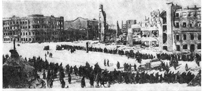
Der Rote Platz in Stalingrad, wo in einer Warenhausruine das letzte Hauptquartier des AOK 6 war (Februar 1943)

«Am 24. Januar wurde ich zum Stab Paulus gerufen. ... Ich wurde wie ein vornehmer Herzog empfangen. Man bot mir Zigaretten, Kaffee, französischen Kognak usw. an. Aus den weiteren Gesprächen wurde klar, dass wir gemäss Führerbefehl bis zur letzten Möglichkeit kämpfen sollten, dass es aber auch wünschenswert wäre, die Person des Oberbefehlshabers und sein nächstes Gefolge aus dem Nahkampf herauszuhalten. Das heisst, noch während des Kampfes sollte ich Verhandlungen über ihre Sicherheit führen. General Schmidt begriff natürlich die offensichtliche Unmöglichkeit eines derartigen Vorgehens. Er erklärte mir, dass ich im geeigneten Moment nach eigenem Ermessen handeln müsse. ... General Paulus sprach sowohl damals als auch später ständig davon, dass er sich unbedingt erschiessen müsse. Seine nächste Umgebung und ich überzeugten ihn davon, dass er dazu nicht