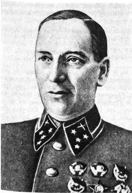
Generaloberst der Artillerie N. N. Voronov, Vertreter des Obersten Hauptquartiers der Roten Armee bei der «Donfront» (Heeresgruppe)

in die Hand zu bekommen. Inzwischen wurden als Flankendeckung links und rechts der 6. Armee die 4. und die 3. rumänische Armee eingeschoben. Was deren Kampfkraft betraf, waren sie äusserst unvollkommen ausgerüstet. So fehlten ihnen die schweren und panzerbrechenden Waffen.