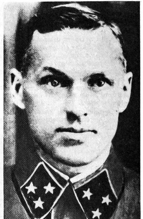
Generalleutnant K. K. Rokossovskij, Oberbefehlshaber der «Donfront»

Voronov fragte bei Stalin nach. Am 4. Januar 1943 erhielt er die Genehmigung. Er musste einen Entwurf zur Durchsicht und Bestätigung vorerst nach Moskau schicken. «Die ganze Nacht arbeitete ich an dem Entwurf. Ich hatte erstmalig mit einer derartigen Sache zu tun», schreibt Voronov, und er hat auch recht. Seit Beginn des deutsch-russischen Krieges war erstmalig die Lage entstanden, dass die Russen aus der Position der Stärkeren den bedrängten Deutschen diktieren konnten. Das Ultimatum geben wir deswegen in seinem Wortlaut wieder, da es auch im Laufe des weiteren Fortganges des Krieges stets dasselbe Schema hatte und aller Wahrscheinlichkeit nach auch heute noch als Vorlage zu ähnlichen Aufforderungen dienen kann: