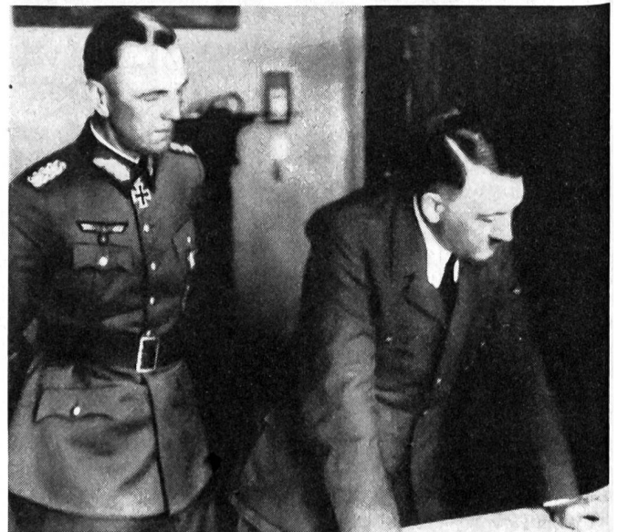
Generalleutnant Friedrich Paulus, Oberbefehlshaber der 6. Armee bei Hitler im Führerhauptquartier (Sommer 1942)

Der Feldzug nach Stalingrad begann am 14. Juli 1942. Die 6. Armee sollte unter General Paulus die Stadt nehmen und die Landbrücke zwischen Don und Wolga sperren. Die 4. Panzerarmee des Generals Hoth sollte gleichzeitig östlich des Dons in nordöstlicher Richtung auf Stalingrad vorgehen. Die Russen wichen aus bis in das Weichbild der Stadt. In verbissene Strassenkämpfe verwickelt, sollte die in vorangegangenen Kämpfen schon ermüdete 6. Armee Stalingrad erobern. Der russische Widerstand versteifte sich zur Sehens. Hitler, der die Wolgastadt schon Anfang September gern in Besitz genommen hätte, musste sich mit Teilerfolgen trösten. Erst Mitte September war die nördliche Hälfte der Stadt in deutschem Besitz. Doch im übrigen Stalingrad harrten die Russen weiterhin aus. Die oberste deutsche Führung verlangte nun auch deren Vernichtung, um dadurch das gesamte Westufer Stalingrads