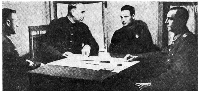
Das erste Verhör des Generalfeldmarschalls. Am Tisch in der Mitte: General Sumilov.

Am 30. Januar war es dann soweit. Paulus' Stab befand sich in den Ruinen des Warenhauses am Roten Platz in Stalingrad, im Befehlsbunker des Kommandeurs der 71. Infanteriedivision, Generalmajor Roske. Dieser hatte den örtlichen Kampf gegen die Russen zu führen, die schon in die Nähe des Gefechtsstandes vorgedrungen waren. Ein weiteres Ausweichen war unmöglich! Jeder im Bunker wusste nun, dass das Ende in unmittelbarer Nähe stand. Paulus selbst — so Oberst Adam in seinen Erinnerungen —