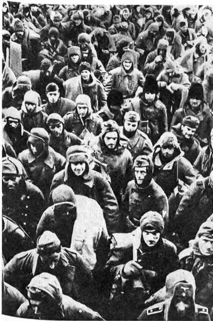
Eine Kolonne Stalingradgefangener, bestehend aus deutschen und rumänischen Soldaten