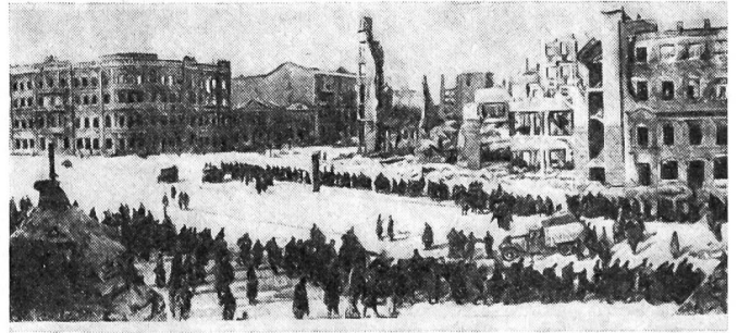
Der Rote Platz in Stalingrad, wo in einer Warenhausruine das letzte Hauptquartier des AOK 6 war (Februar 1943)

«Am 24. Januar wurde ich zum Stab Paulus gerufen. ... Ich wurde wie ein vornehmer Herzog empfangen. Man bot mir Zigaretten, Kaffee, französischen Kognak usw. an. Aus den weiteren Gesprächen wurde klar, dass wir gemäss Führerbefehl bis zur letzten Möglichkeit kämpfen sollten, dass es aber auch wünschenswert wäre, die Person des Oberbefehlshabers und sein nächstes Gefolge aus dem Nahkampf herauszuhalten. Das heisst, noch während des Kampfes sollte ich Verhandlungen über ihre Sicherheit führen. General Schmidt begriff natürlich die offensichtliche Unmöglichkeit eines derartigen Vorgehens. Er erklärte mir, dass ich im geeigneten Moment nach eigenem Ermessen handeln müsse. ... General Paulus sprach sowohl damals als auch später ständig davon, dass er sich unbedingt erschiessen müsse. Seine nächste Umgebung und ich überzeugten ihn davon, dass er dazu nicht