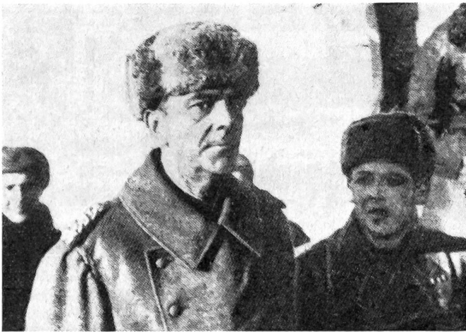
Generalfeldmarschall Friedrich Paulus in russischer Gefangenschaft (1. Februar 1943)

wusste wohl, was Hitler von ihm «als letzte Pflichterfüllung» verlangte. Er konnte sich jedoch zu einem Selbstmord nicht entscheiden. Noch am selben Tag liess Paulus zwei Funkprüche an Hitler entsenden, in denen er seinem obersten Befehlshaber ein weiteres Ausharren in Stalingrad («bis zum letzten Mann und bis zur letzten Patrone») versicherte und seinen Glückwunsch zum Jahrestag der Machtergreifung aussprach («Noch weht die Hakenkreuzfahne über Stalingrad. Unser Kampf möge den lebenden und kommenden Generationen ein Beispiel dafür sein, auch in der Hoffnungslosigkeit nie zu kapitulieren!»).