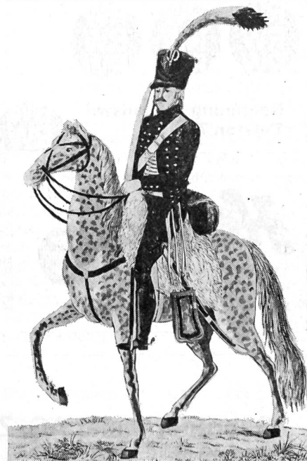
Alte Schweizer Uniformen 26