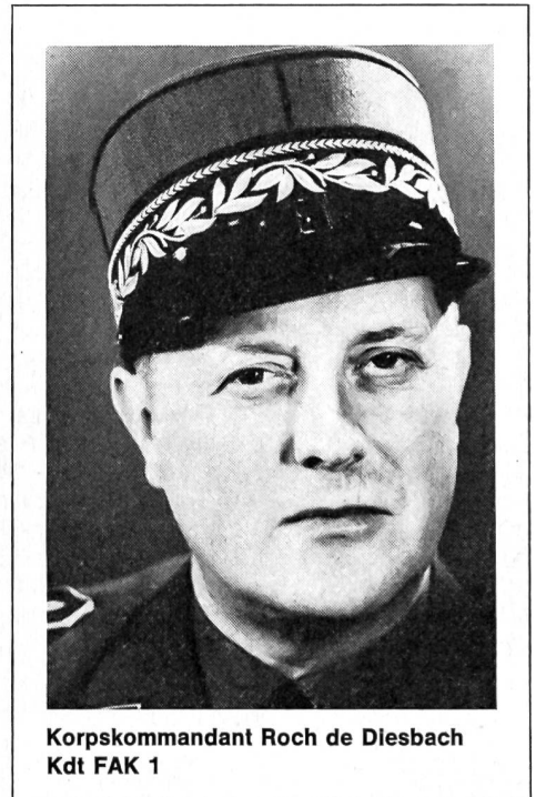
Korpskommandant Roch de Diesbach Kdt FAK 1

Mit dem Generalstabschef hat auch der Kdt FAK 1, Korpskommandant Roch de Diesbach, den Bundesrat um seine Entlassung auf den 31. Dezember 1971 nachgesucht. Und wie dem Generalstabschef ist auch dem Gesuch des Korpskommandanten Roch de Diesbach unter Verdankung der geleisteten Dienste entsprochen worden. Der Demissionär ist 1909 als Bürger von Freiburg i. Ue. als Angehöriger eines Geschlechts geboren worden, das der Schweizerischen Eidgenossenschaft seit Jahrhunderten wie-