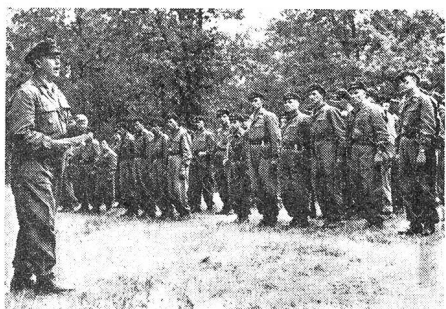
Arbeitermiliz erhält Kampfauftrag während einer Übung.