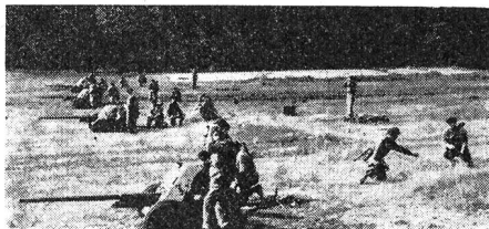
Schiessübung mit 40-mm-Pak.

Die Arbeitermiliz ist in Züge, Kompanien und Bataillone gegliedert. Zurzeit verfügt sie über etwa 70 Bataillone; 60 davon sind im Land verteilt und 10 bilden die Budapest-er Arbeitermiliz, wobei die Industriequartiere der Hauptstadt über je ein Bataillon verfügen. Die Gesamtstärke der Arbeitermiliz wird mit etwa 35 000 Mann beziffert.