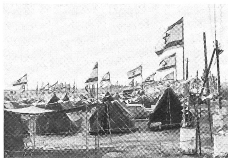
Das fast unübersehbare Lager von Beit-El.

«Wir sind glücklich hier zu sein», stand auf einem mit dem weissen Kreuz im roten Feld und dem blauweissen Davidsstern geschmückten Spruchband in hebräischer Sprache, das eine der zahlreichen Schweizergruppen am Mittwochnachmittag, 19. September, beim Einmarsch in Jerusalem mitrug. Dieser Einmarsch der 25 000