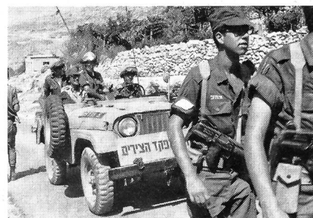
Bewaffnete mobile Patrouille der Armee, wie sie überall unterwegs auftauchten und die Sicherheit garantierten.

Abschluss und Höhepunkt des unvergesslichen Marsches bildete am Mittwoch der Einmarsch der Wanderer durch die vom Jaffator der Altstadt ausgehende Jaffa-Road in Jerusalem. Um die Einmarschzeit auf zwei Stunden verkürzen zu können, marschierten die Gruppen der Armee und des Auslandes und der zivilen Israeli, die alle drei Tage mitmachten, aus der Richtung des Jaffatores in die Neustadt von Jerusalem, während im Kontermarsch die rund 11 000 Jugendlichen, zumeist Gruppen, marschierten, die nur die beiden letzten Marschtage bestritten. Auf einem als Ehrentribüne hergerichteten Balkon hatten mit zahlreichen Gästen Israels Ministerpräsidentin Golda Meir, der Bürgermeister von Jerusalem, Teddy Kollek, Generalstabschef David Elazar, der Marschleiter und weitere Vertreter aus Armee und Behörden Platz genommen, um auch den zahlreichen Schweizergruppen mit ihren Schweizer und Kantonsfahnen herzlich zuzuwinken. Die Strasse war dicht gesäumt durch die Bevölkerung, welche sich dieses bunte Schauspiel der singenden und spielenden Marschgruppen, ein Sinnbild der freudig, aber diszipliniert vorwärts stürmenden Jugend, nicht entgehen lassen wollte.